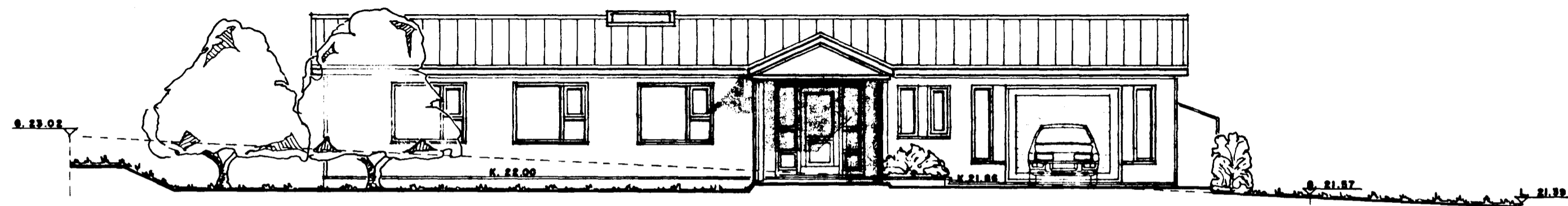
NORÐ - AUSTURHLIÐ. 1:100