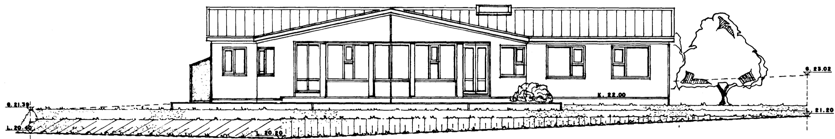
SUÐ - VESTURHLIÐ. 1:100