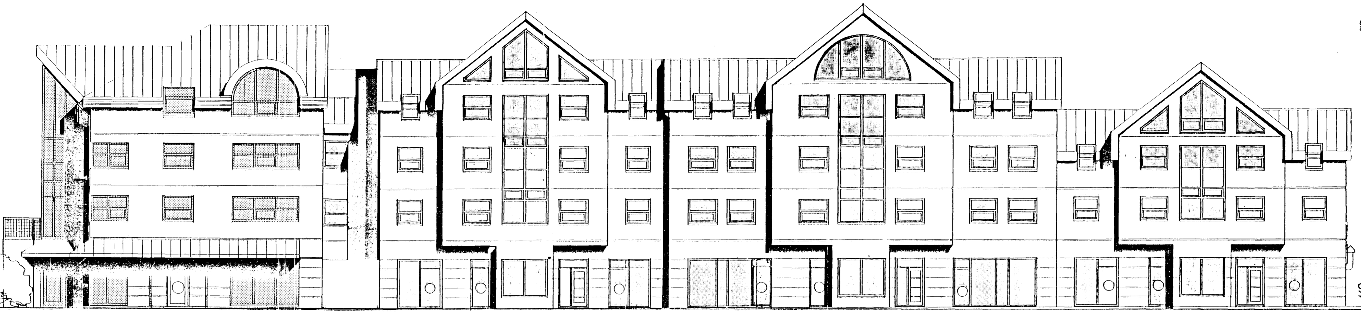
ÚTLIT NORÐUR AÐ LÆKJARGÖTU.