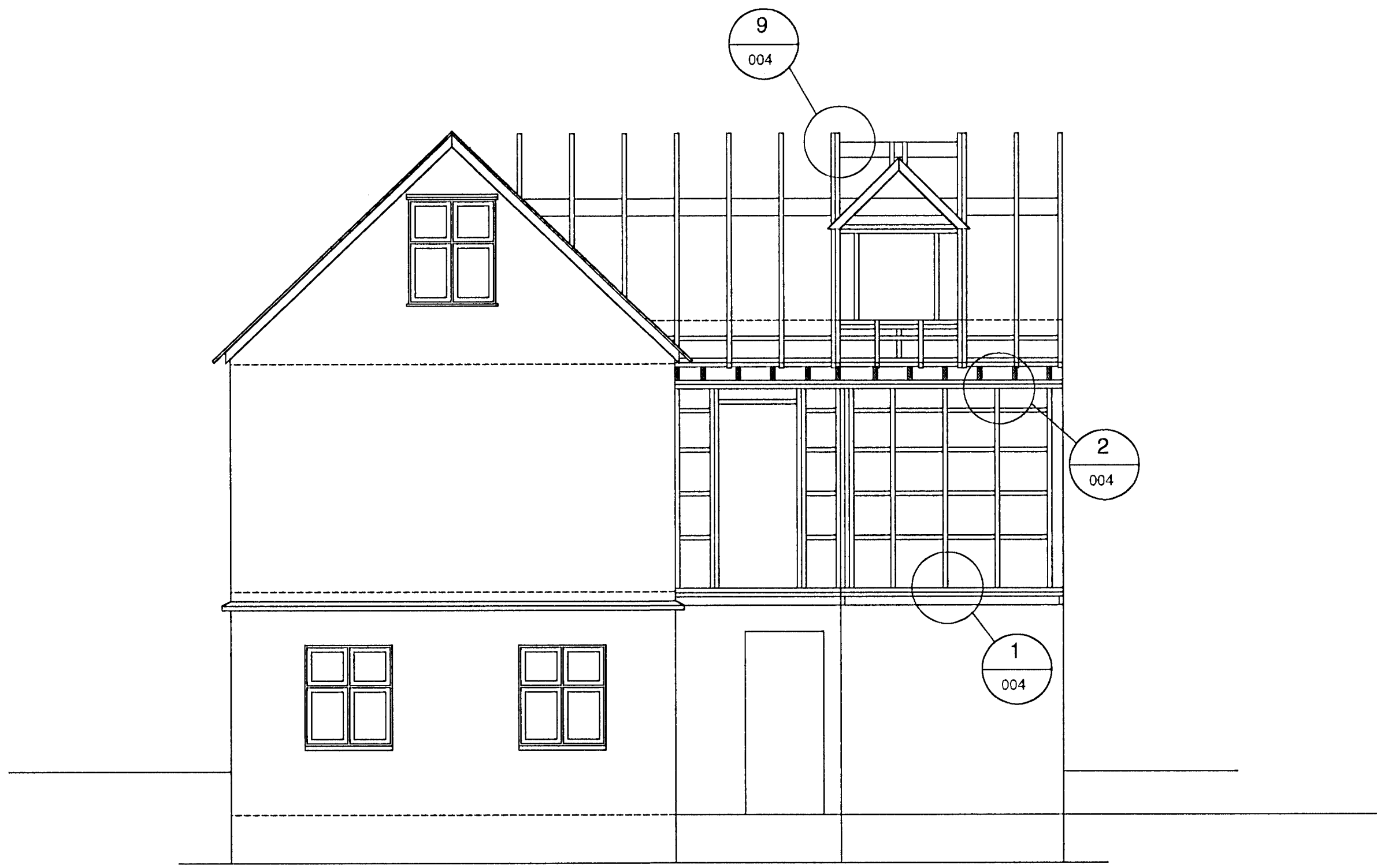
A SNID 001 M=1:50