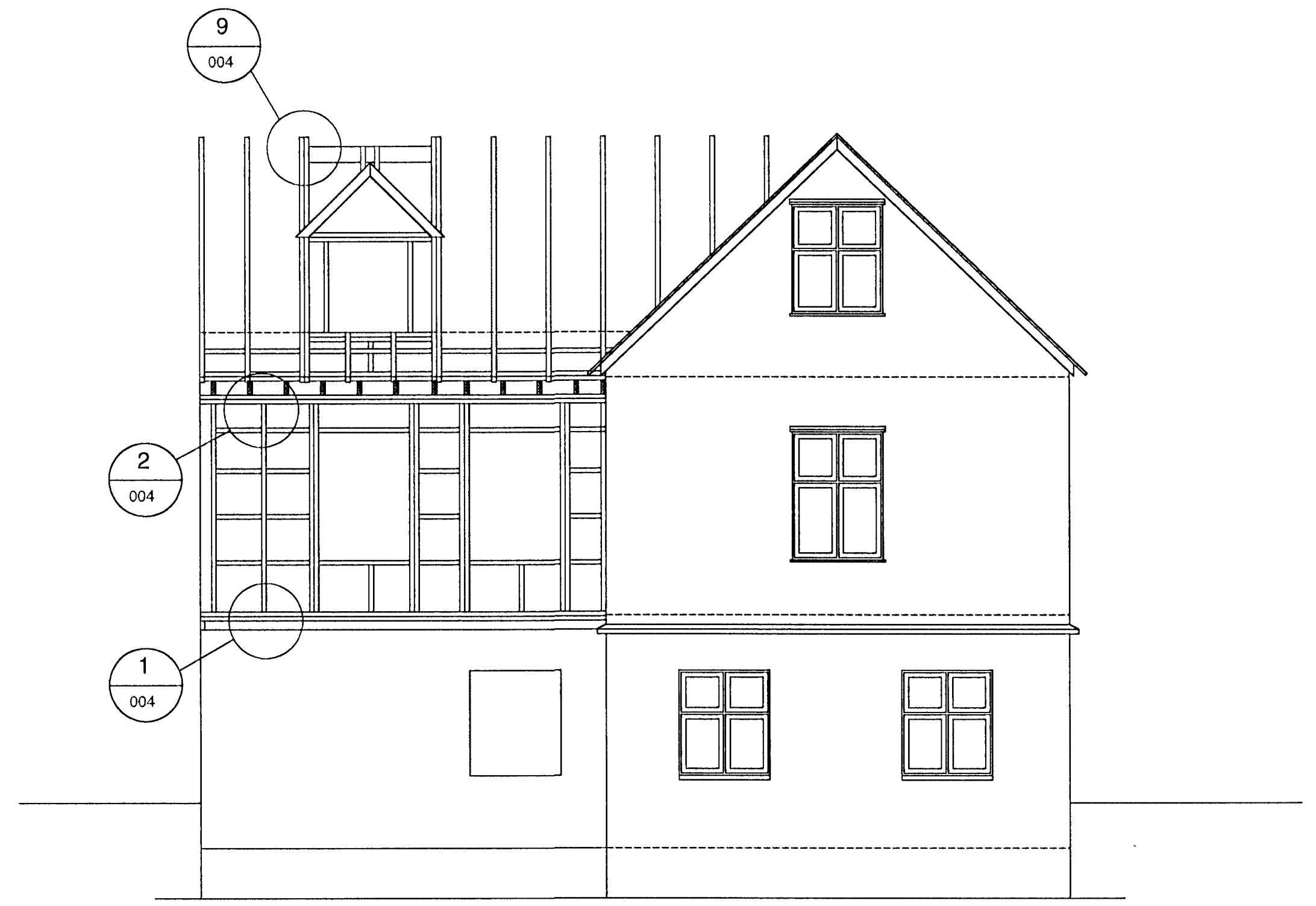
B SNID 001 M=1:50