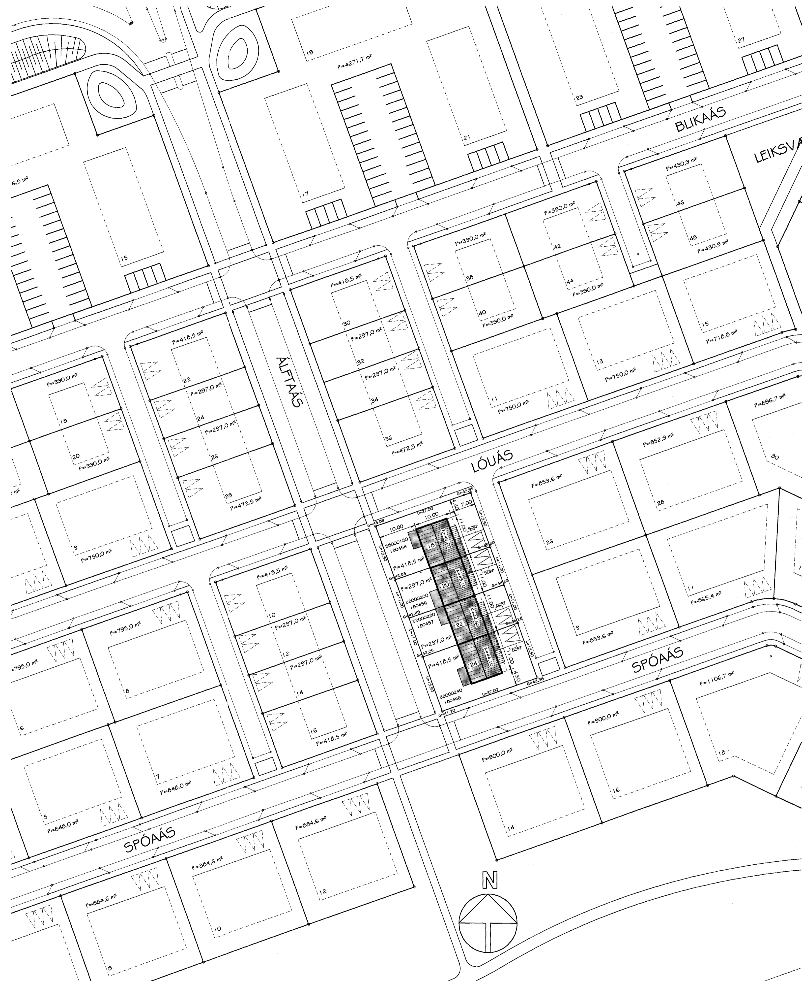
AFSTÖÐUMYND MKV. 1:500

BYGGINGARLÝSING: Húsið er steypt upp á höfðbundin hátt. Dúrvarvirki þaks er timbur. Gluggar og þakbrúnir úr timbri. Á þaki er þakstál. Einangrun úrveggja er 100 mm steinullplasteanangrun. Einangrun þaks er 200 mm steinull. Undir botnplötu og niður með sókkum er einangrað með 75 mm plasteanangrun. Húsið verður málhúðað að utan og málað í ljósum lit. Á lóðarmörkum skal frágangur lóðar gerður í samráði við lóðarhafa aðlaggjandi lóðar. Gler í gluggum skal vera K-gler. Klæðningar innan á veggjum og lofti í bílskúr skulu ekki vera lakan en af flokki 1. Klæðningar innan á lofti íbúðar skulu ekki vera lakan en af flokki 2. Veggur milli íbúðar og bílskúrs skal vera a.m.k. EI60. Frágangur gróðuris á lóð og lóðarmörkum skal vera í samræmi við ákveðin greinar GÖ.3 í byggingarreglugerð.