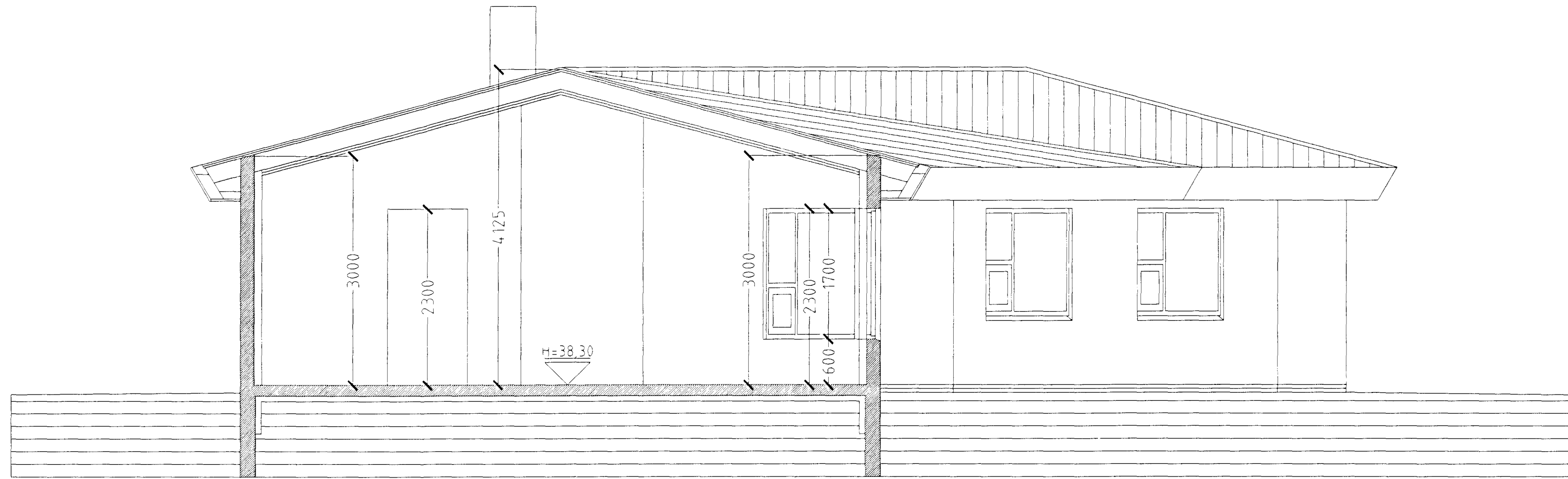
SNID A-A MKV. 1:50.