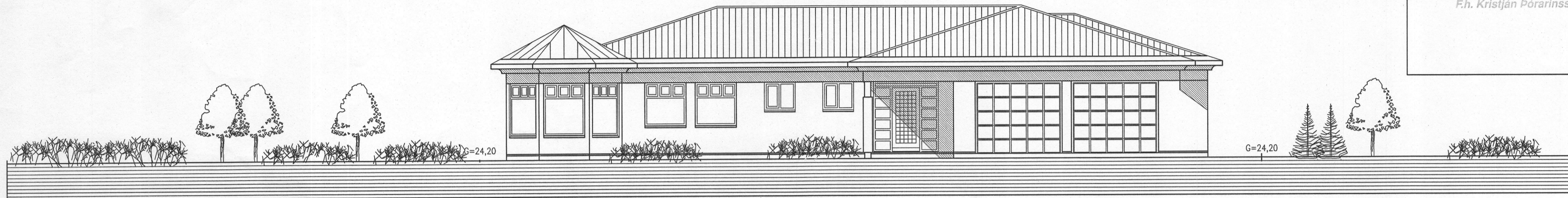
ÚTLIT SUDAUSTUR MKV. 1:100.