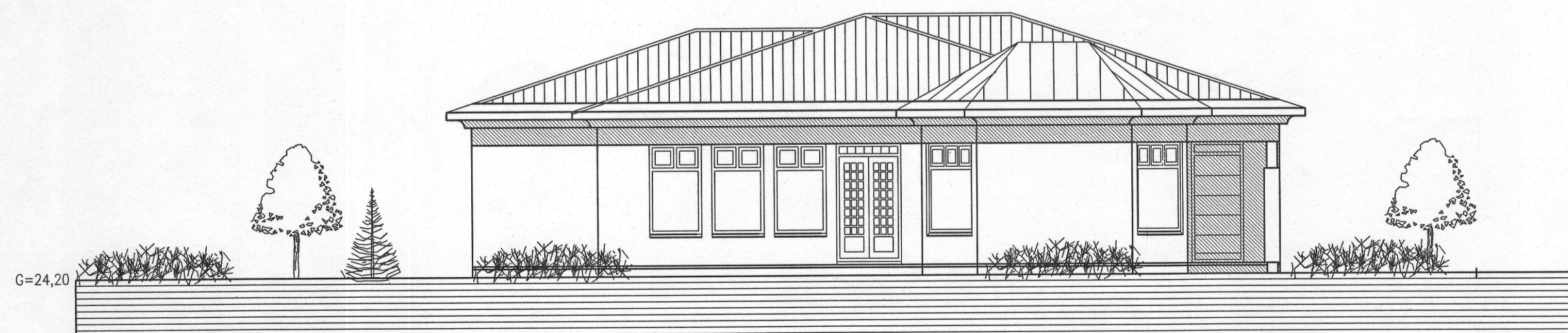
ÚTLIT SUÐVESTUR MKV. 1:100.