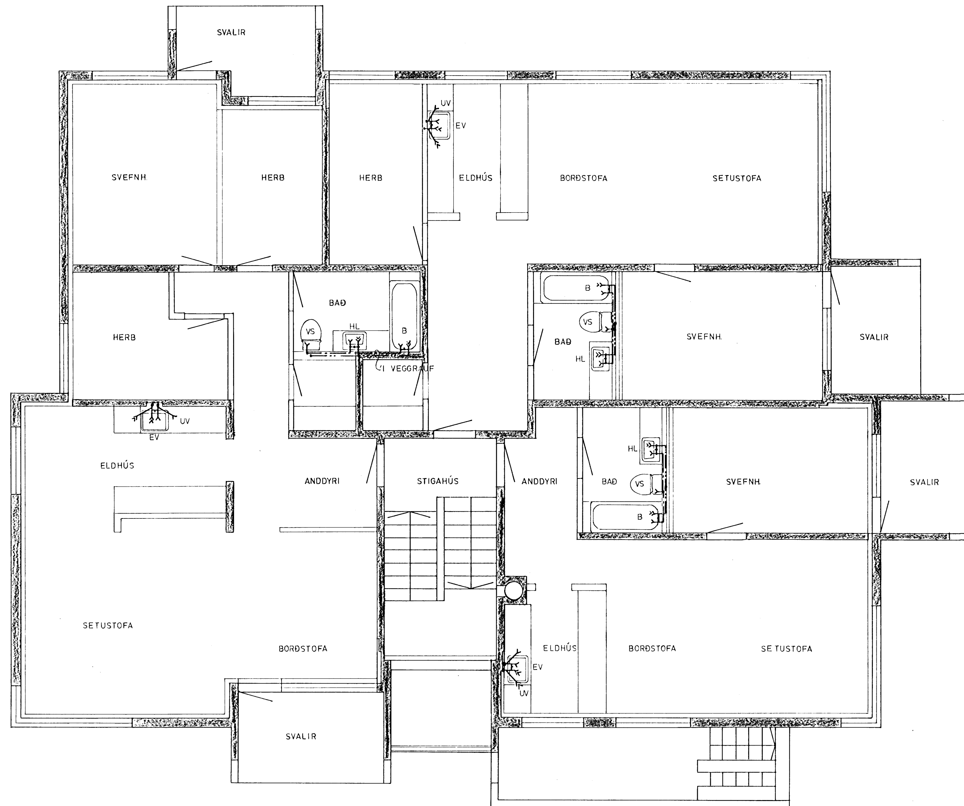
GRUNNMYND 1. HÆÐ