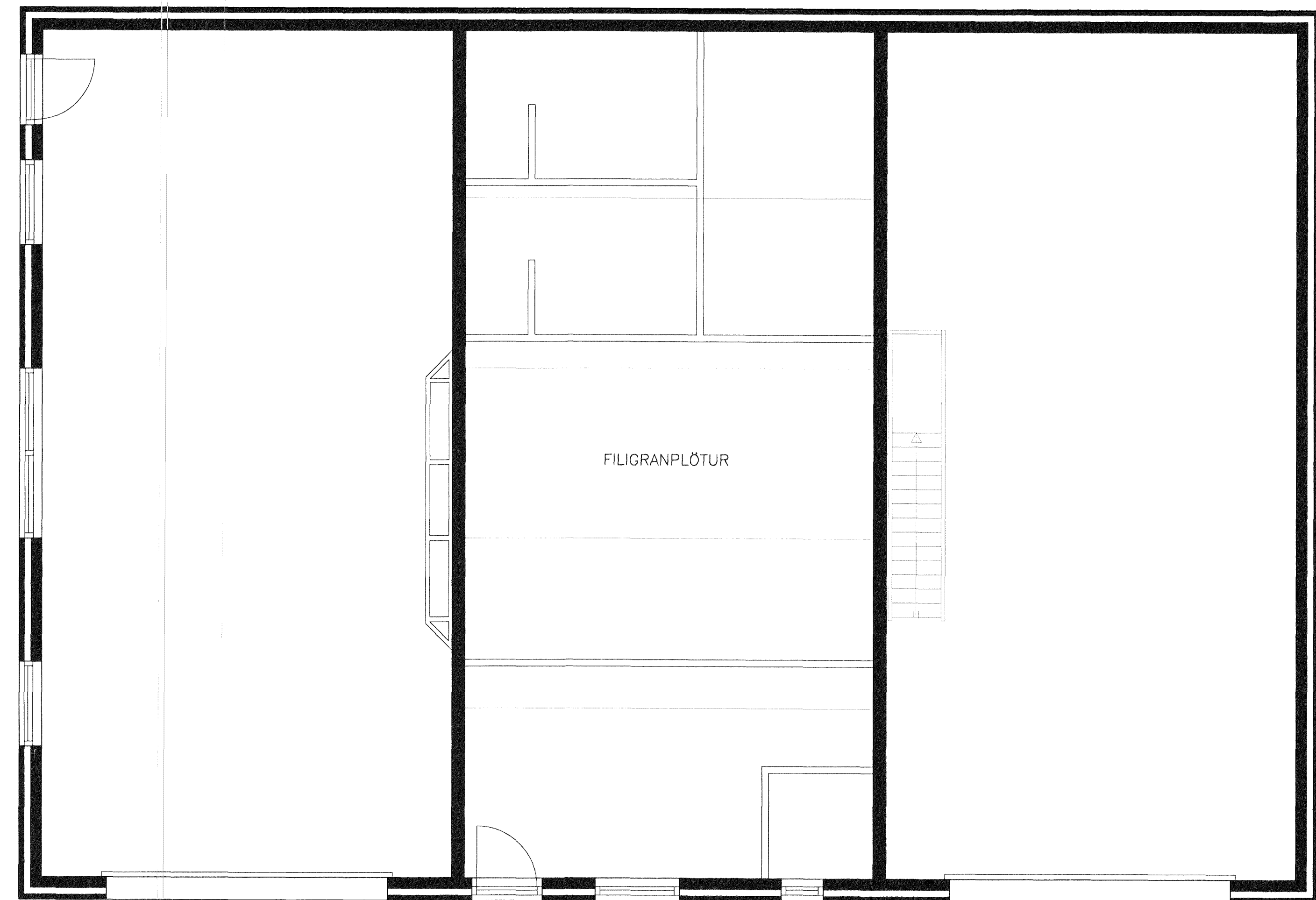
GRUNNMYND AF LOFTUM MKV. 4