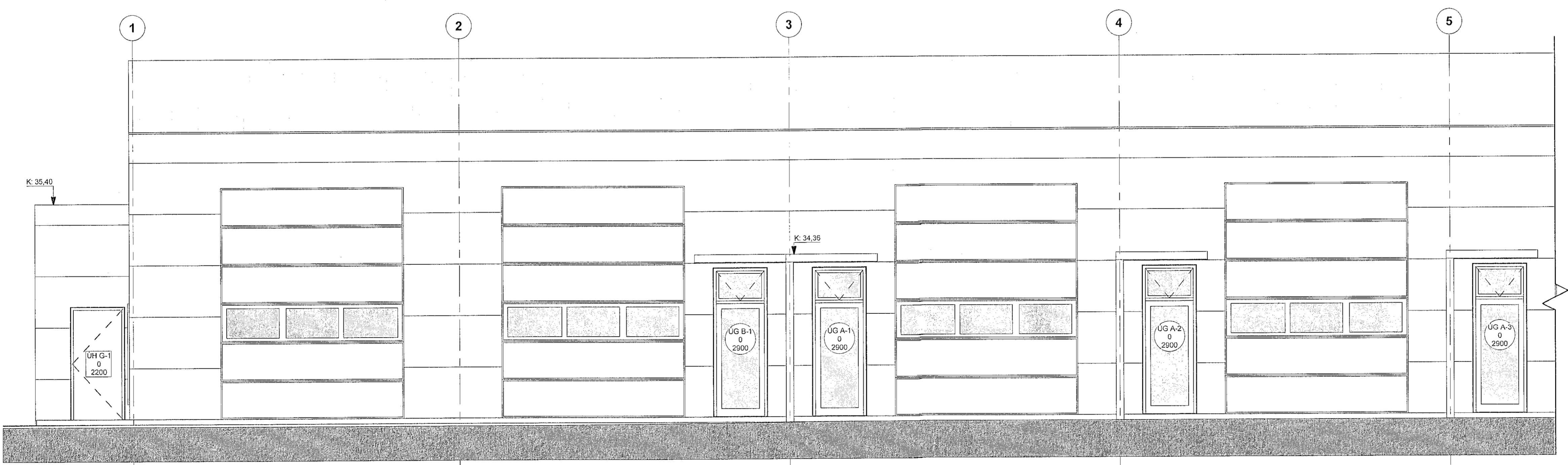
Ásýnd austur suðurhluti 1 : 50