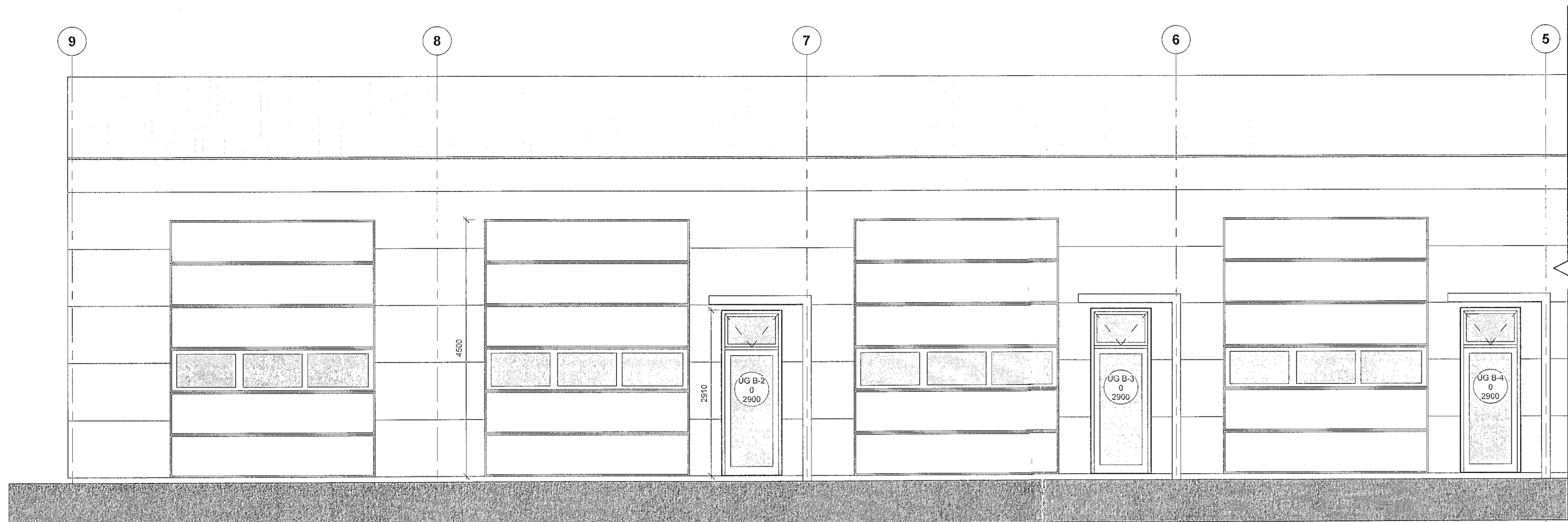
Ásýnd vestur norðurhluti 1 : 50