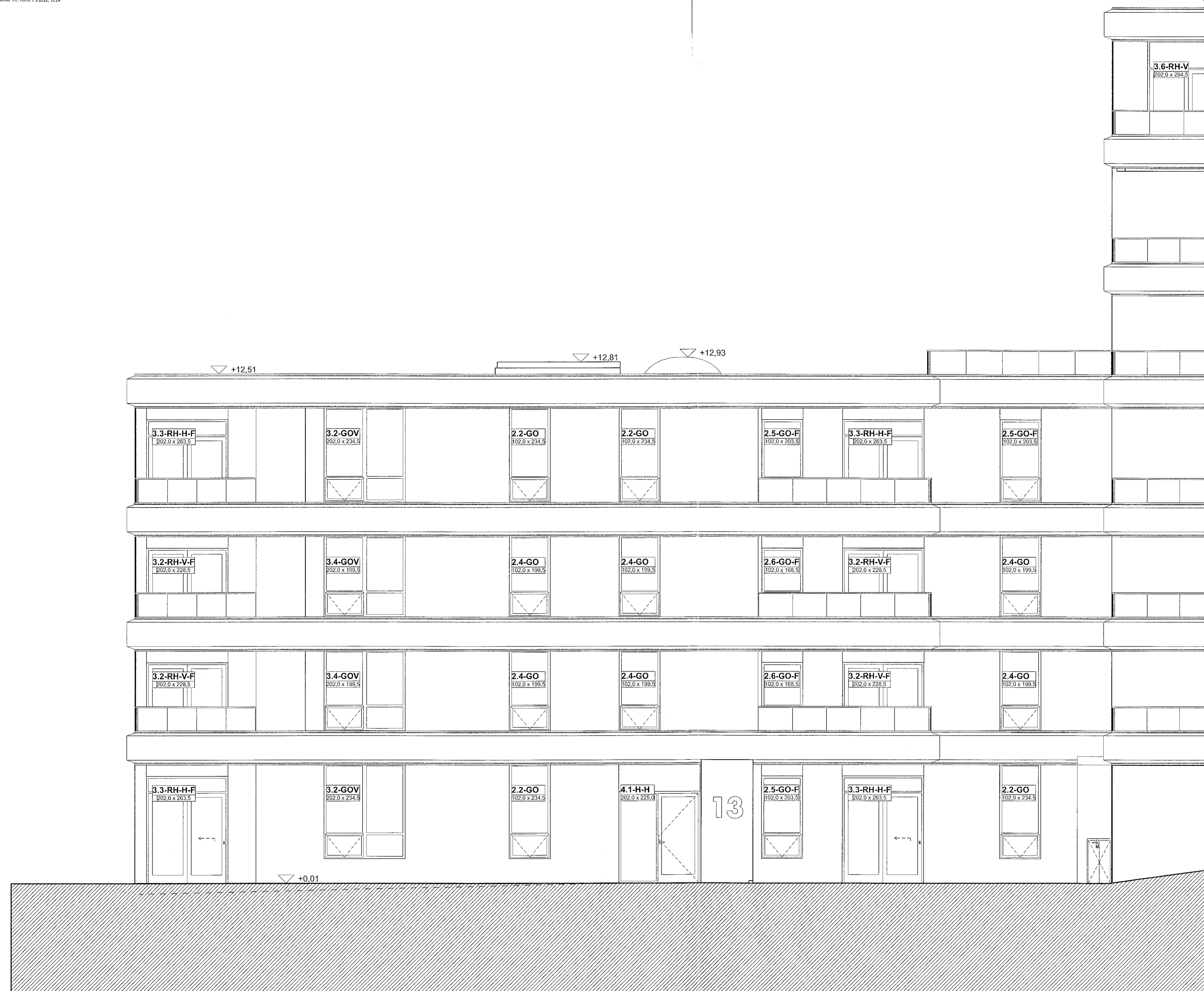
B.SA Suðaustur 1:50