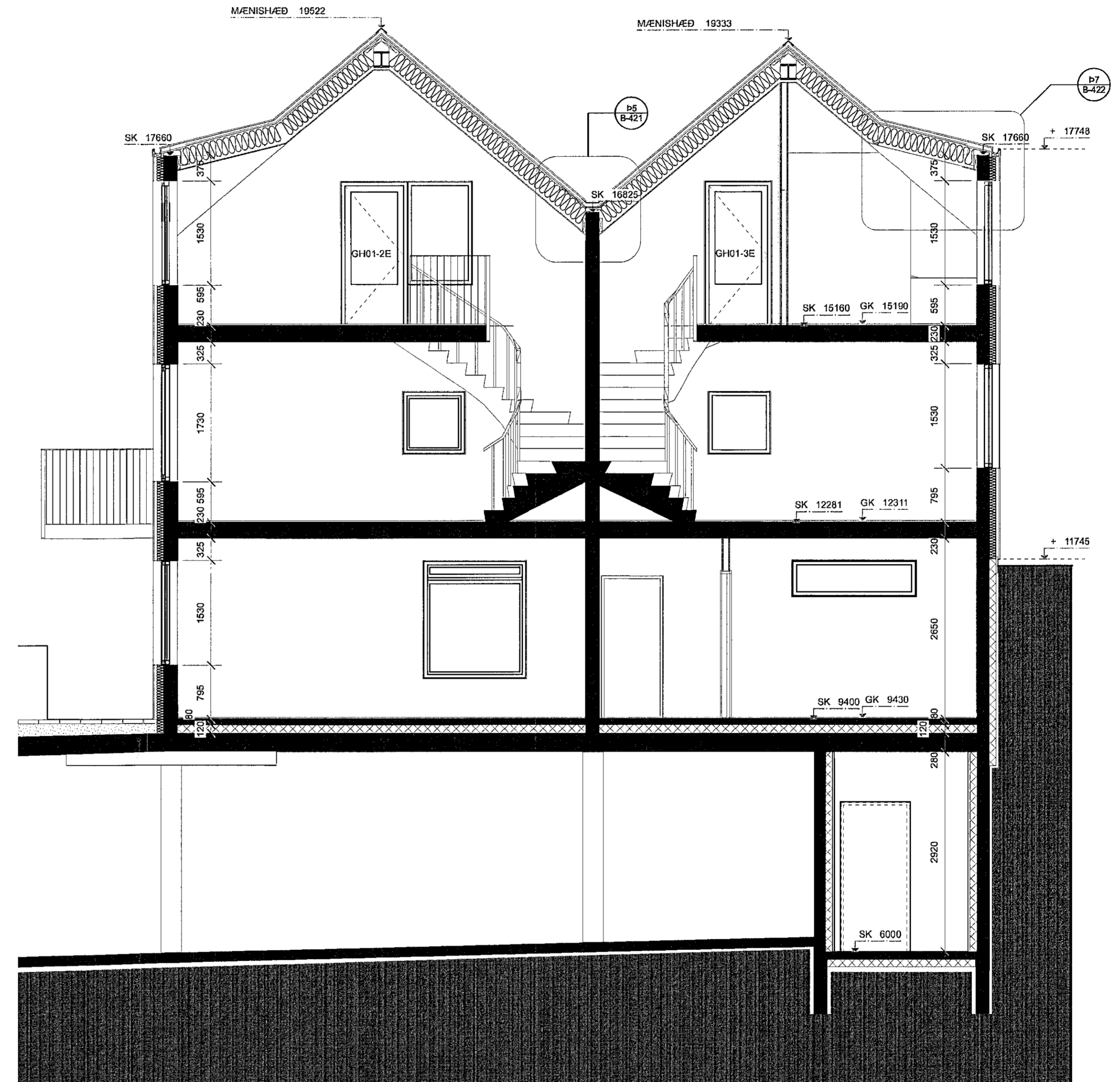
E3 SNEIÐING E3 Skali: 1:50