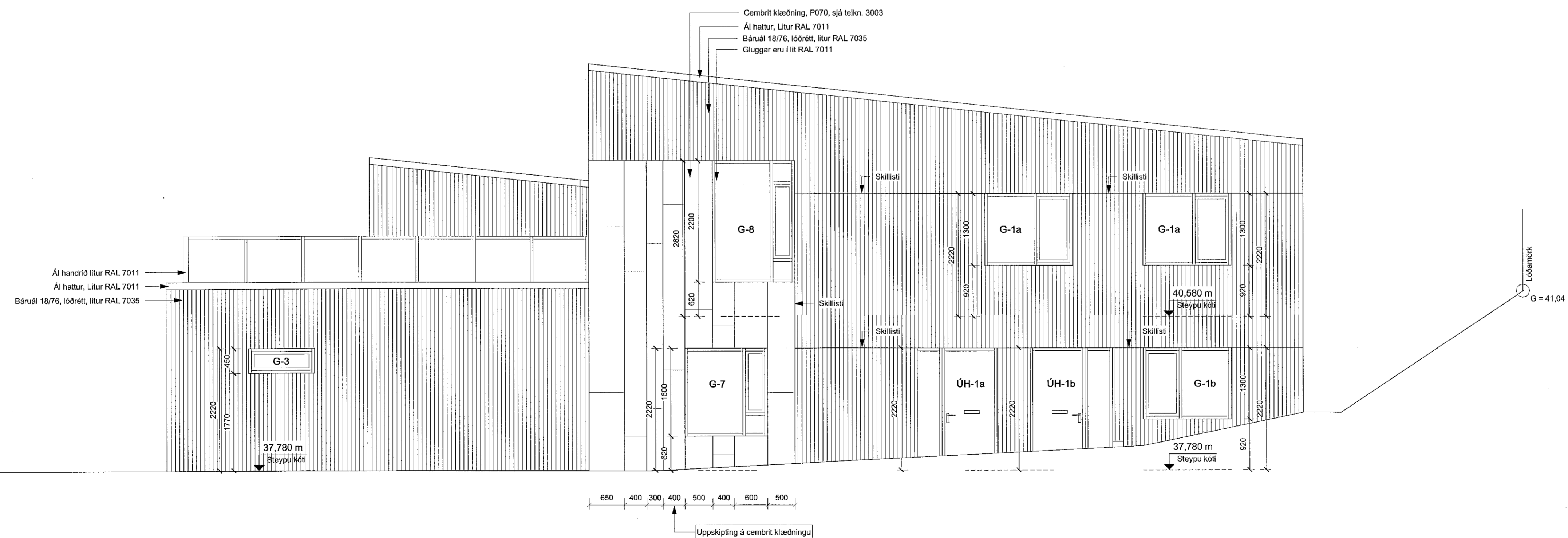
VERKT. - ÁSÝND AUSTUR mkv: 1 : 50