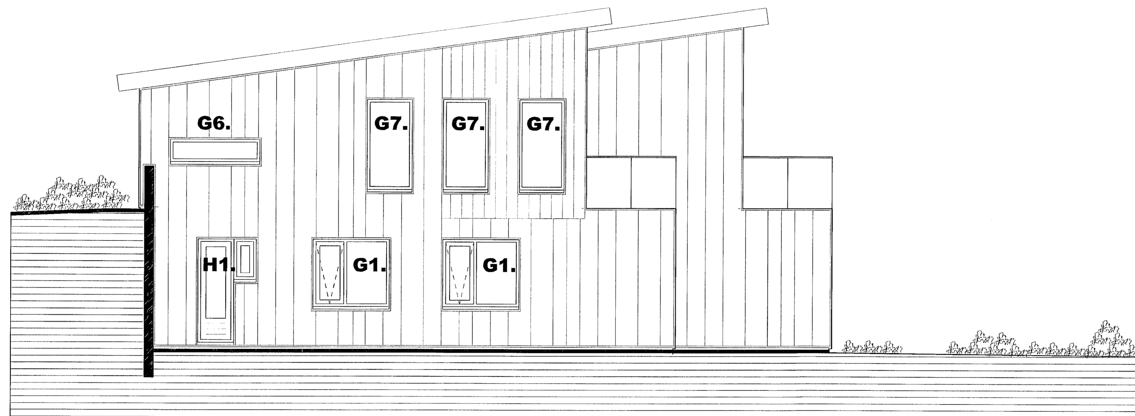
SNIÐ E-E MKV. 1:50.