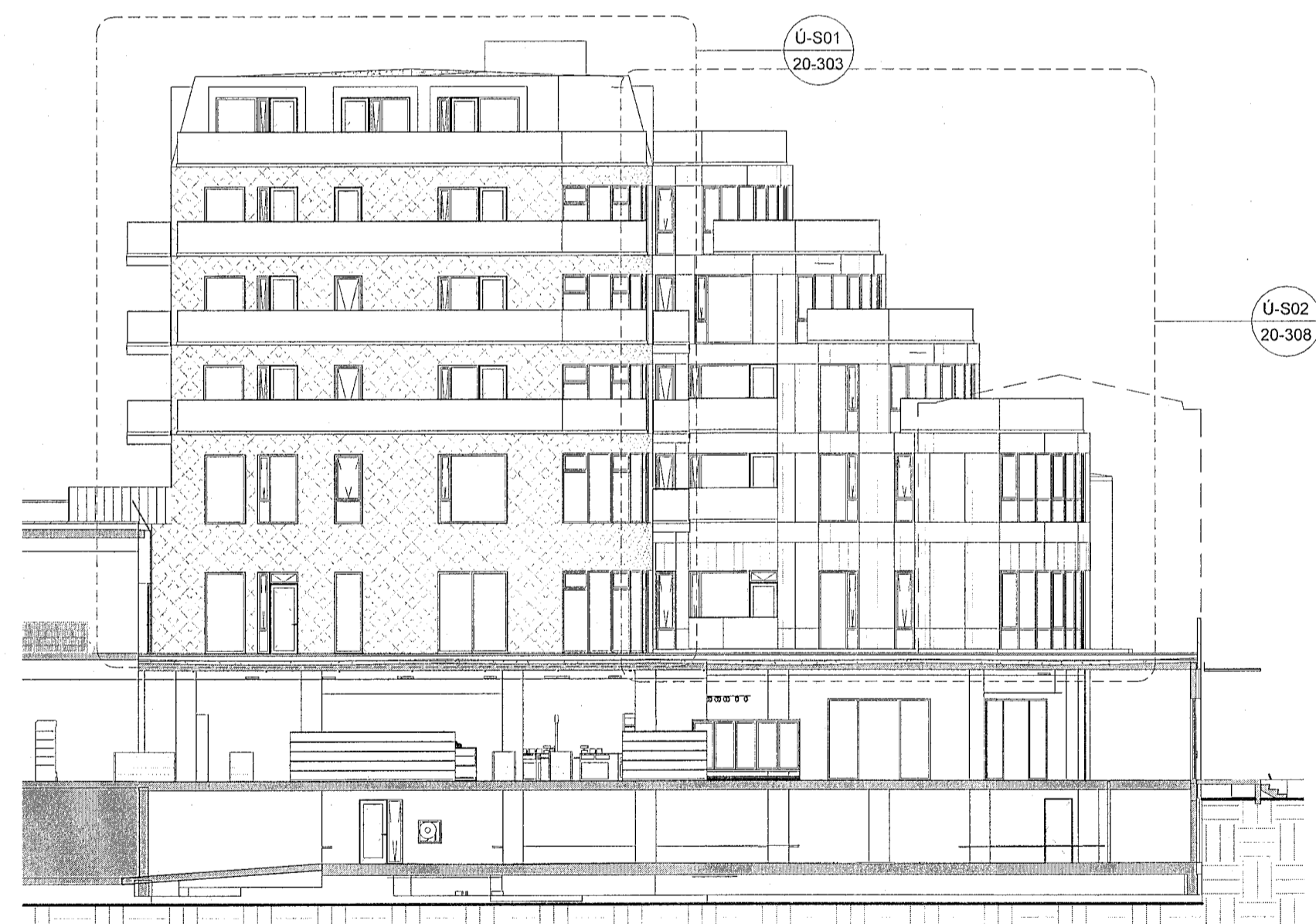
Ú-S Útlit - Verk. Suður - yfirlit 1 : 200