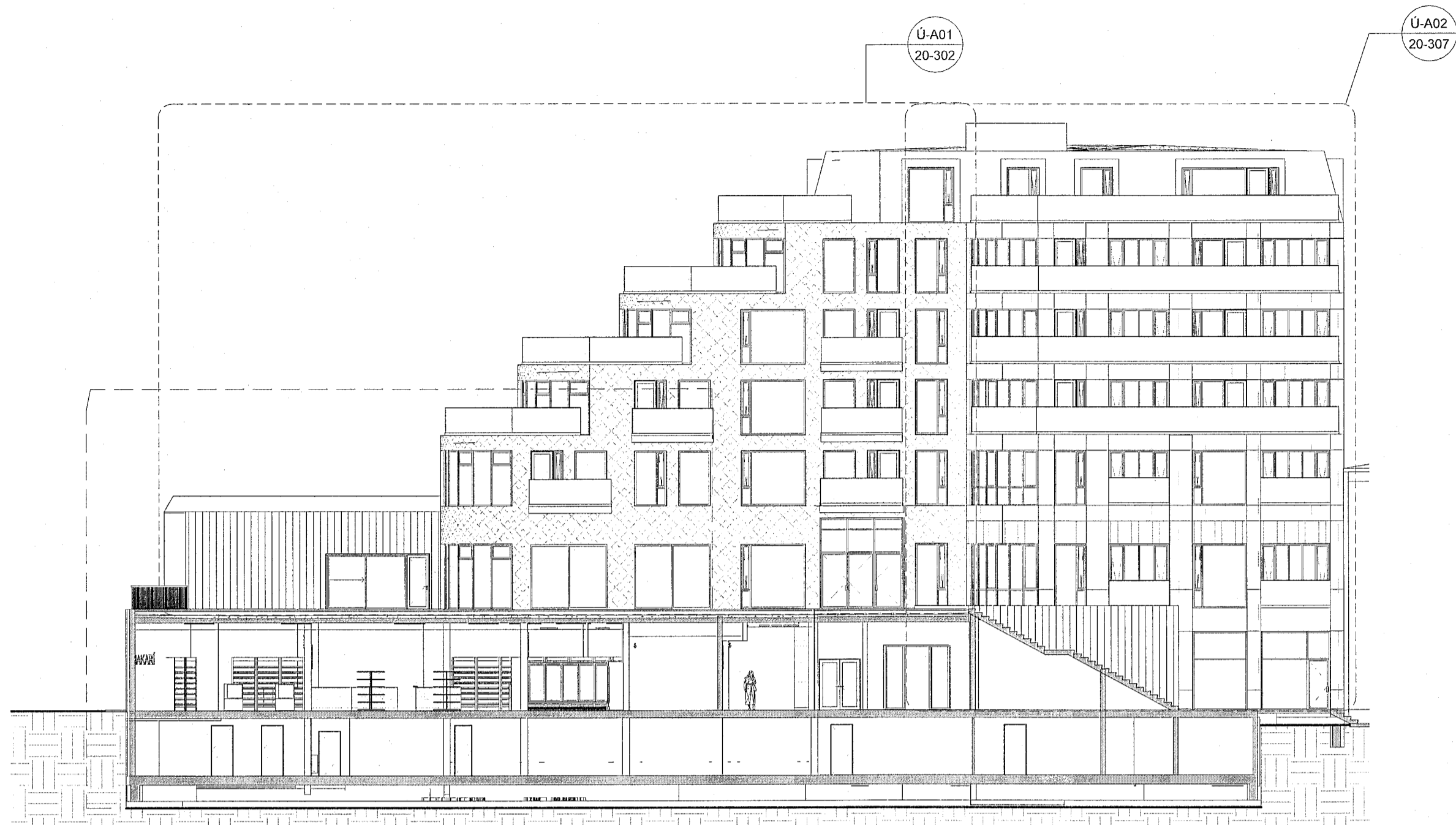
Ú-A Útlit - Verk. Austur - yfirlit 1 : 200

Upprunalegur hönnuður verslunarmíðstöðvarinnar er Erling G. Pedersen