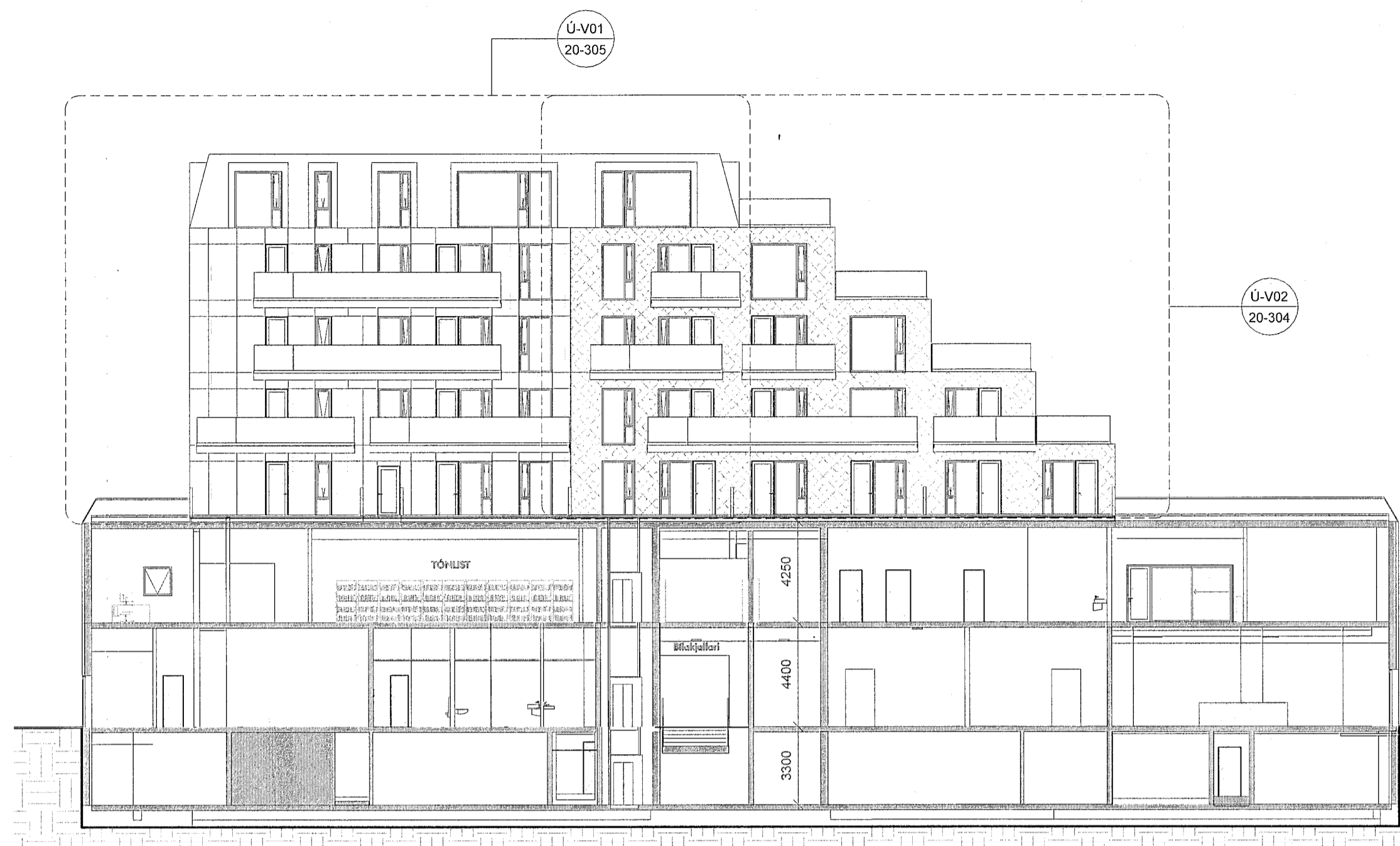
Ú-V Útlit - Verk. Vestur - yfirlit 1 : 200