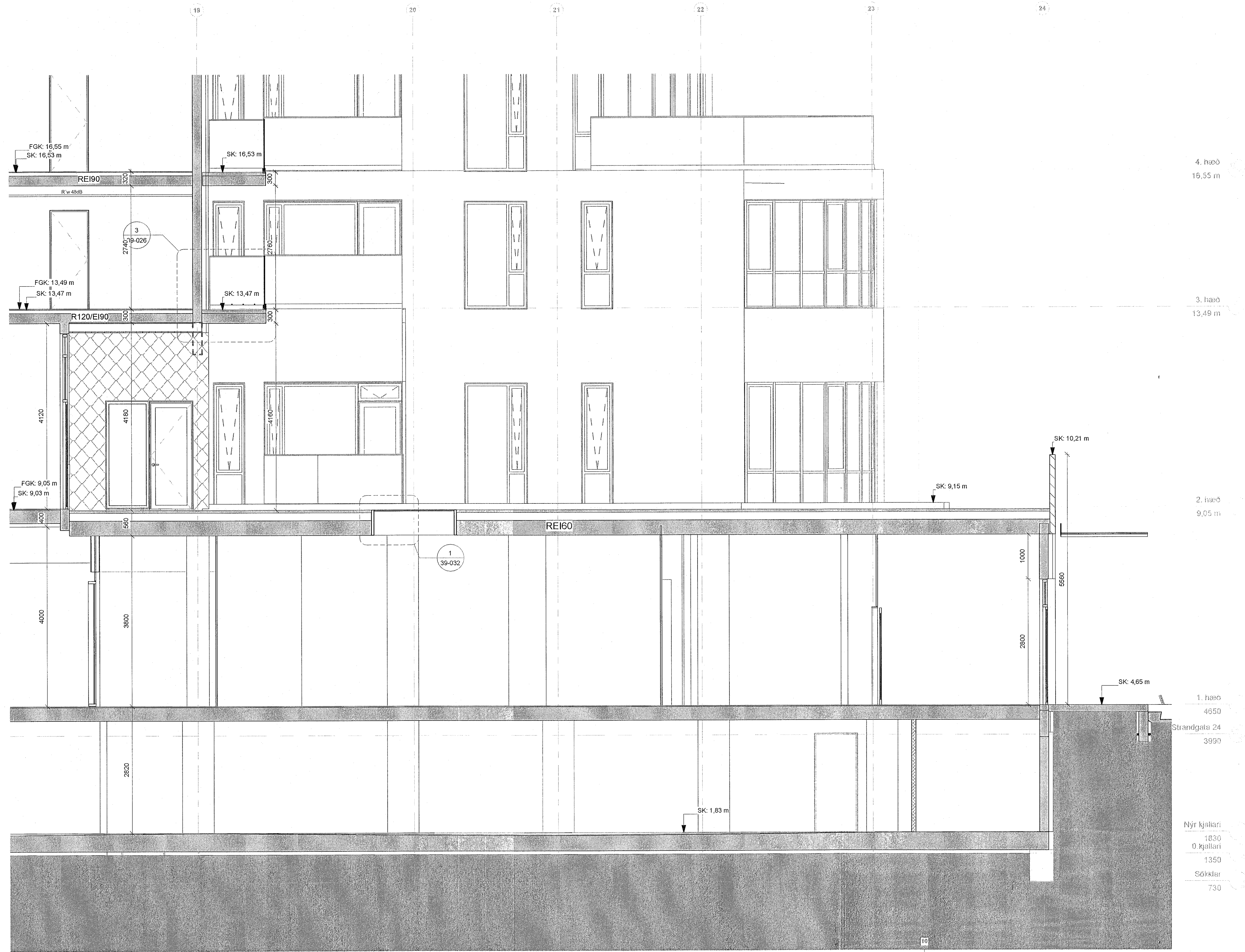
G-G Sneiðing - Verk. G-G - 01 01 1 : 50

Upprunalegur hönnuður verunarmáttöðvarinnar er Erling G. Pedersen