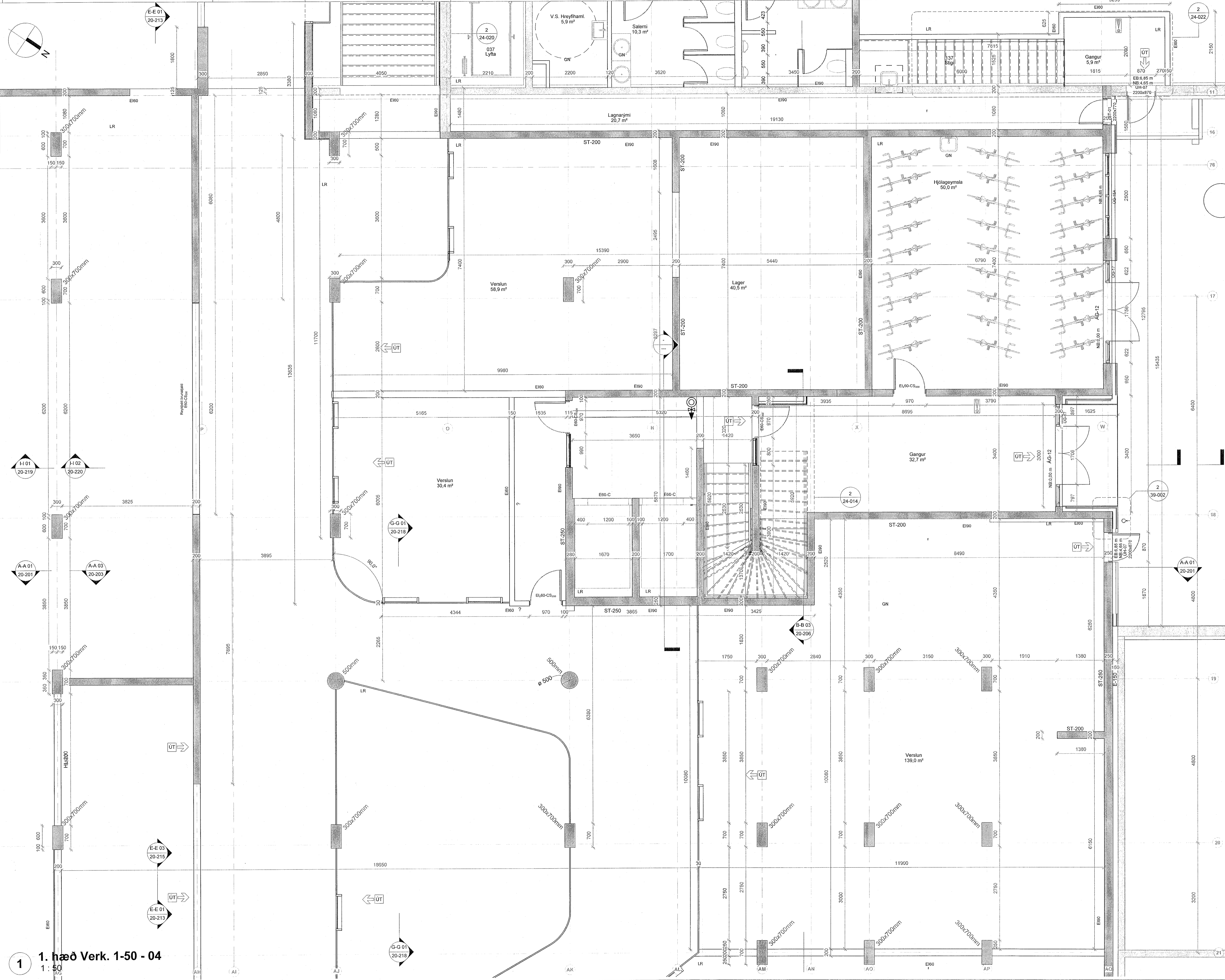
1. hæð Verk. 1-50 - 04 1 : 50