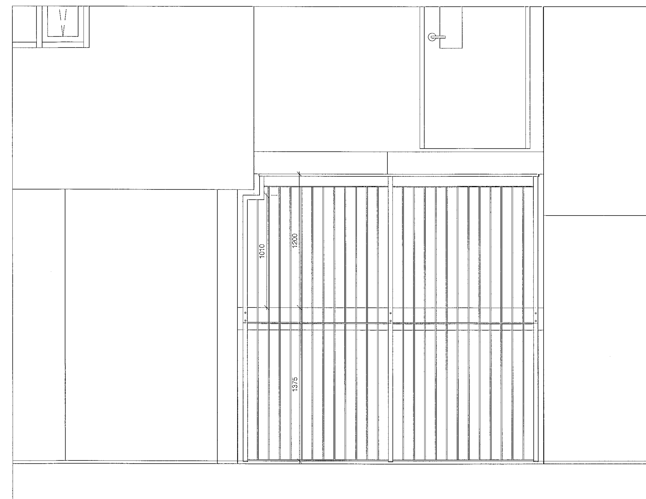
ÁSÝND NORÐUR M. 1:20

Skýringar: Efni í handriðum er zinkhúðað stál. Stoðir eru 40x40x3 mm stálprófilar, ramar eru byggðir úr 6x40 mm flatstáli. Teinar eru 10 mm í þvermál. Handlistar eru 20x50x3 mm stálprófilar.