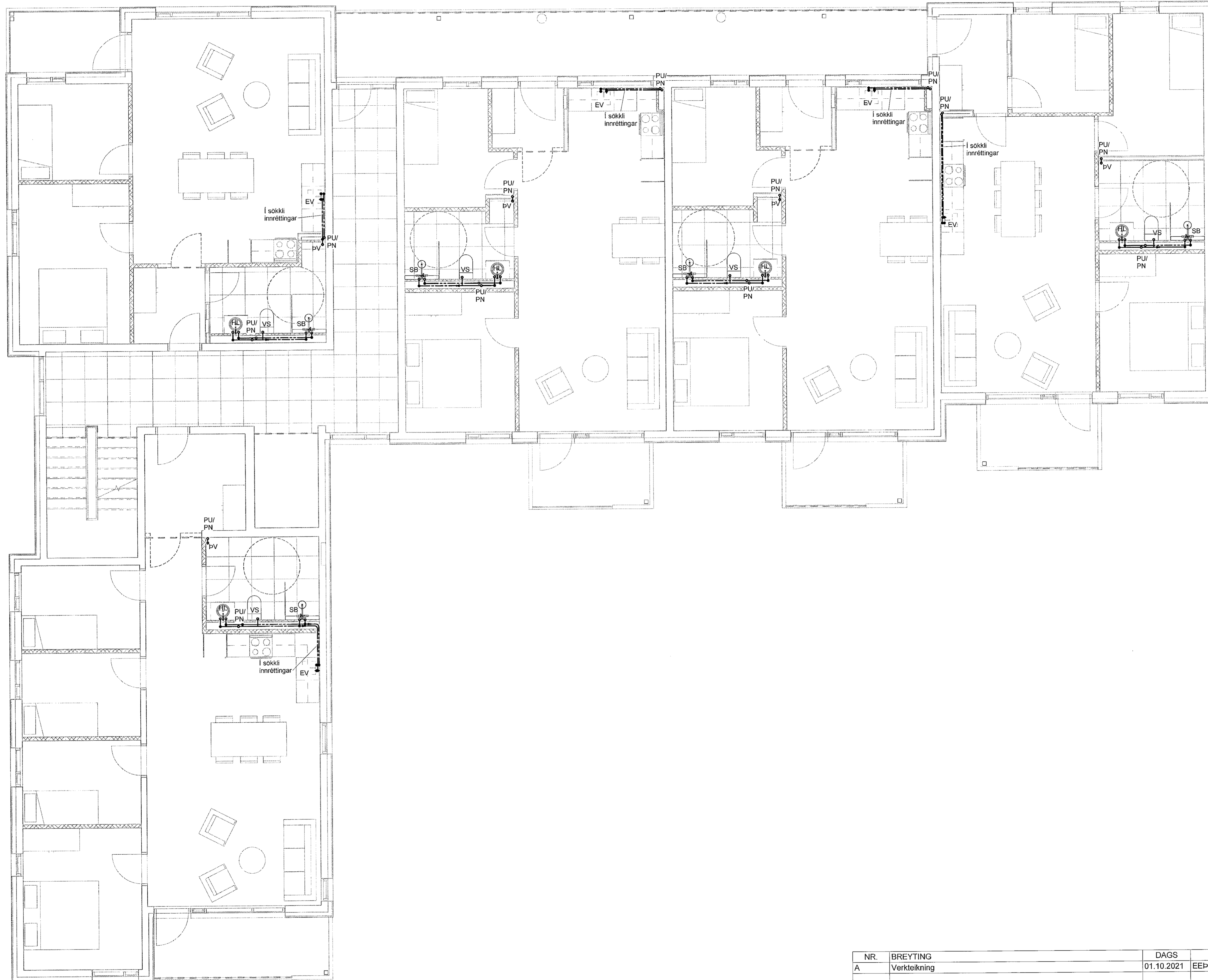
1 2. hæð - 3 1 : 50

VERKNR.: 2104 MKV.: 1 : 50 HANNAÐ: EFP TEIKNAD: AG DAGS: 01.10.2021 YFIRFARID: JPF ÚTGÁFA NR.: A