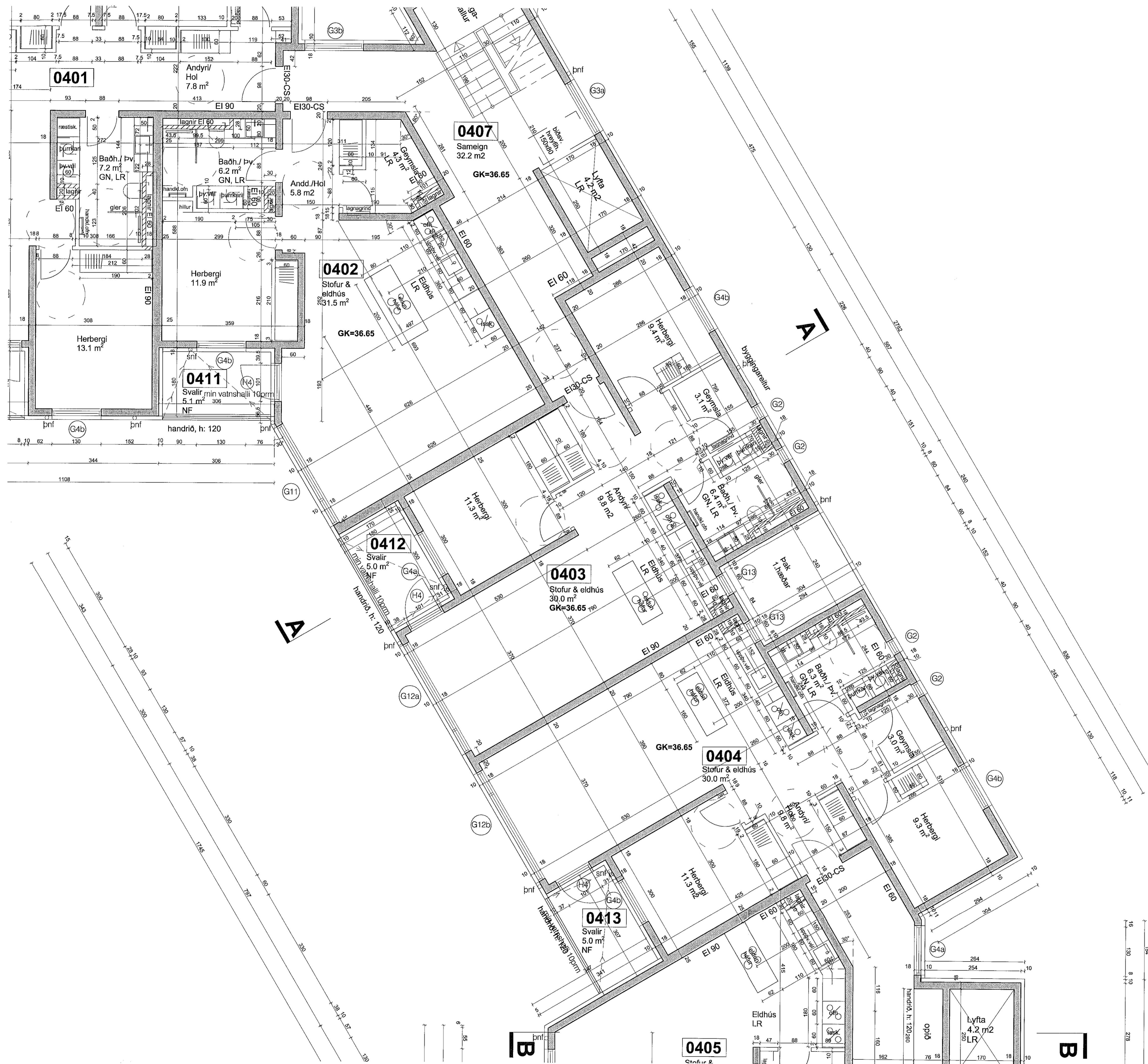
Grunnmynd 4.hæð, Nónhamar 2