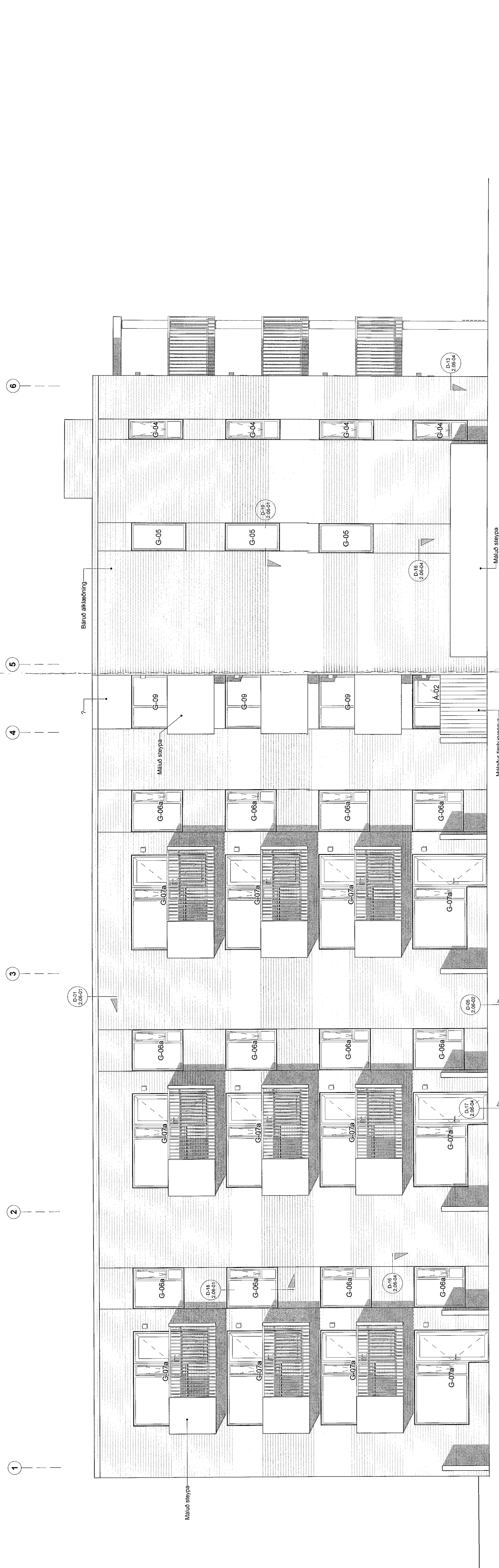
Útlit - Suður 50 hl MÁX: 1:50