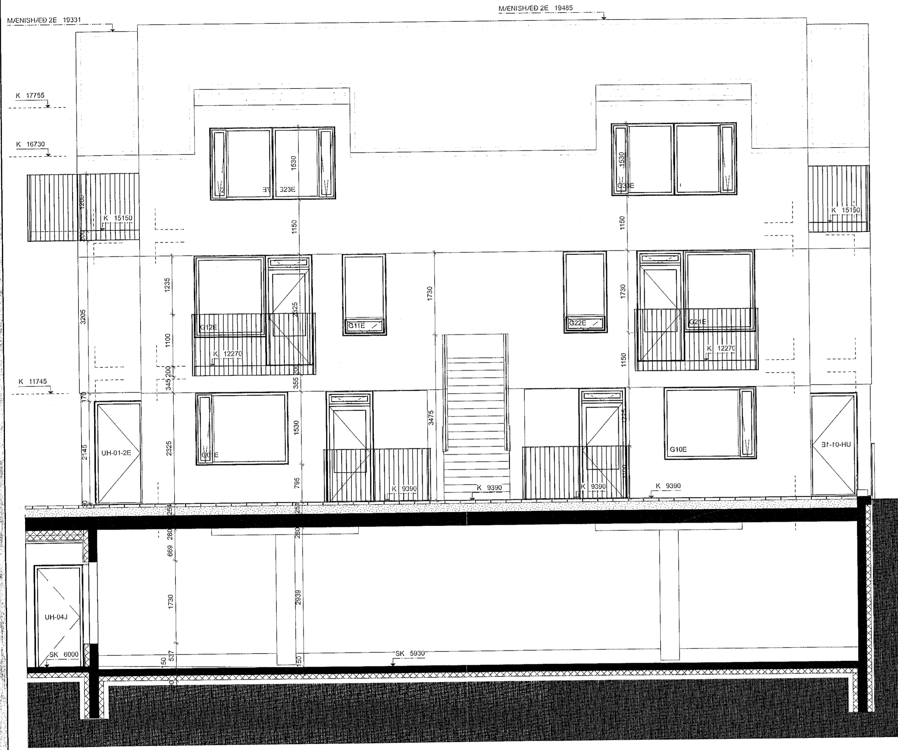
1 2E ÚTLIT VESTUR Skali: 1:50