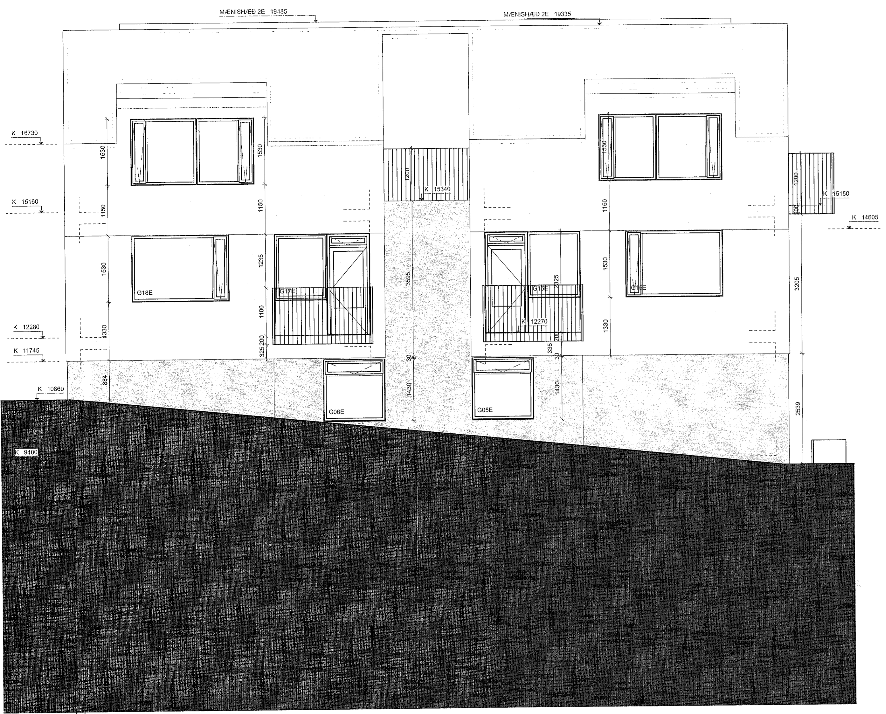
3 2E ÚTLIT AUSTUR Skali: 1:50

Sampykkt þann 18. nóv. 2021 f.h. byggingarfulltrúans í Hafnarfirði Hjálmar A. Jónsson H.A.S.