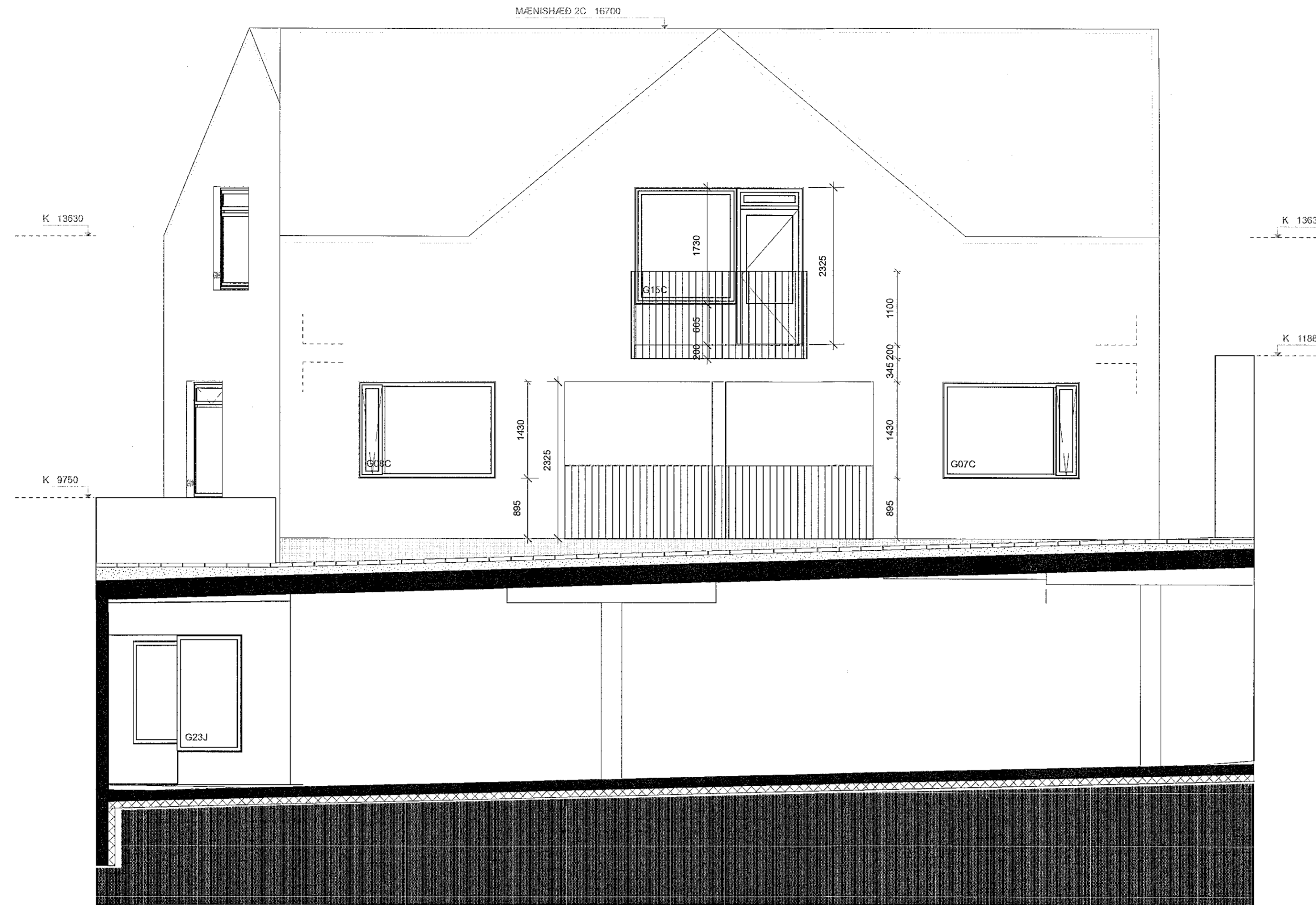
1 2C ÚTLIT SUÐUR Skali: 1:50