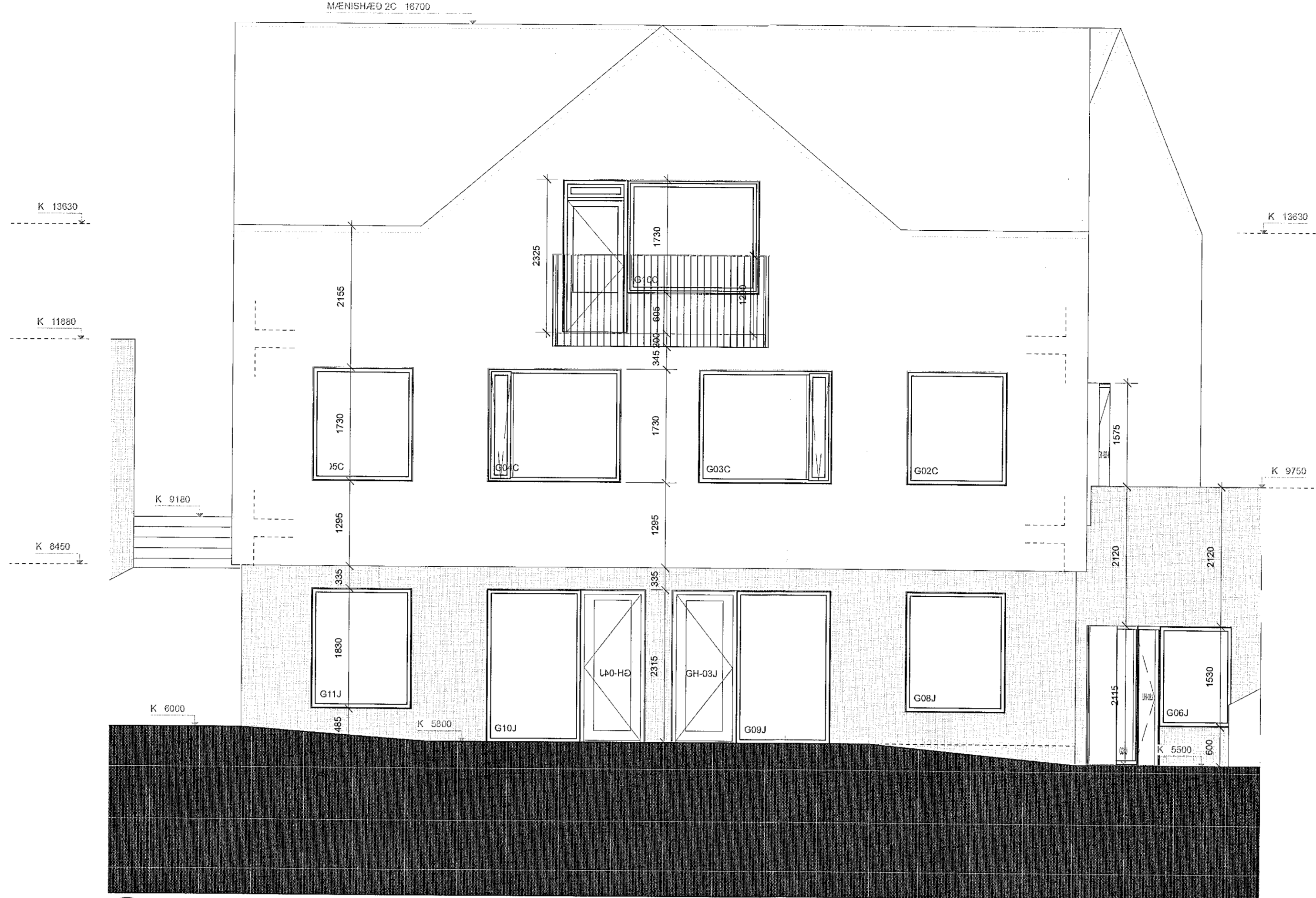
3 2C ÚTLIT NORÐUR Skali: 1:50