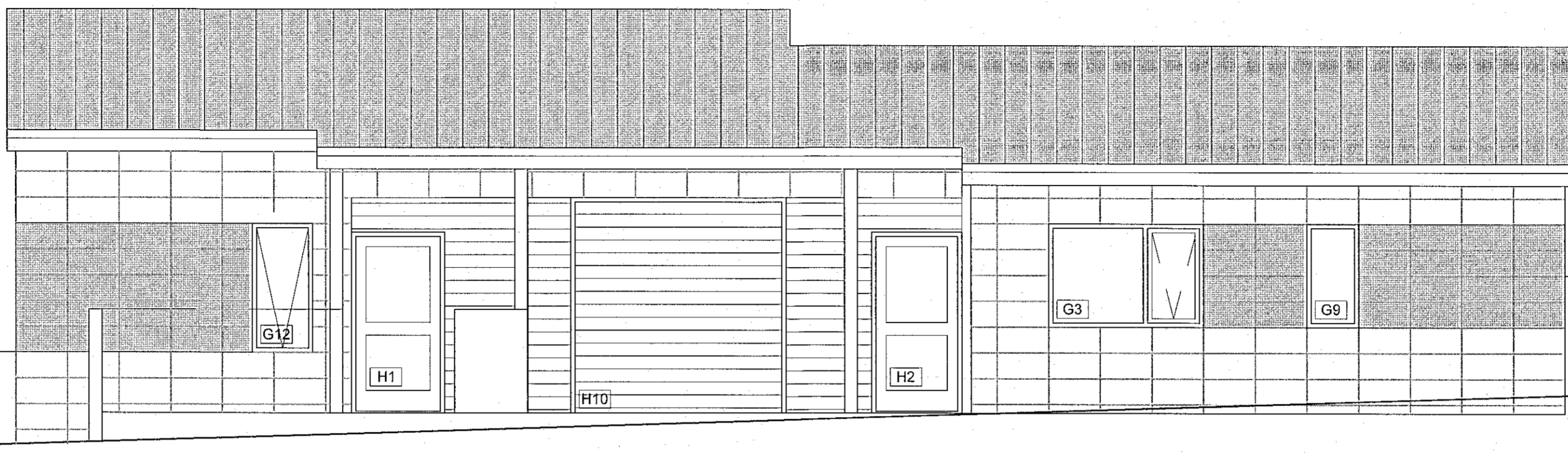
Ásýnd Norð-austur mkv. 1:50