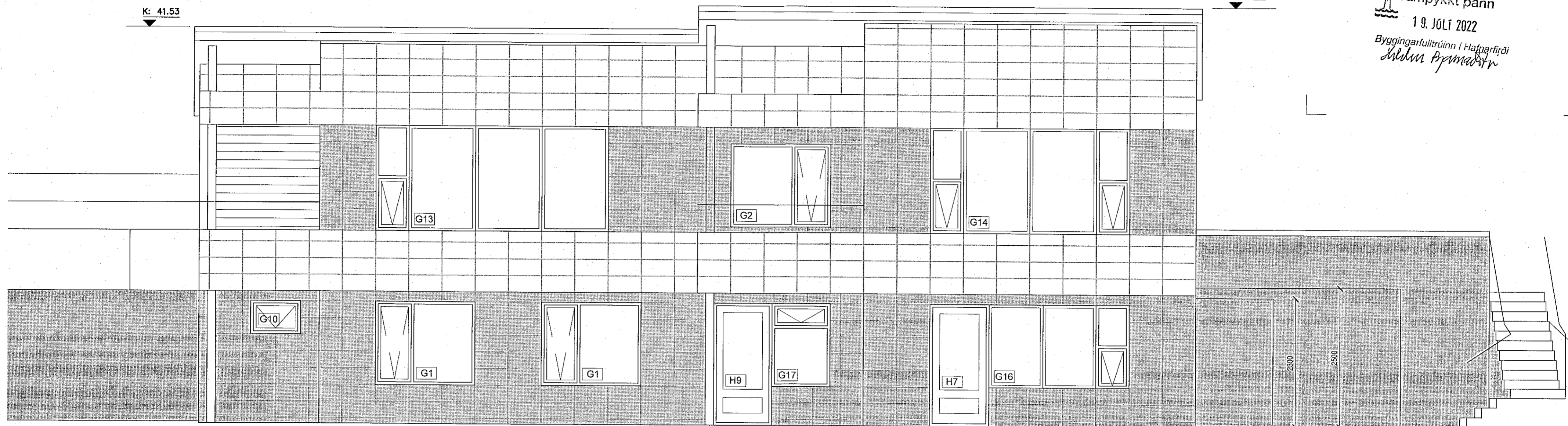
Ásýnd Suð-vestur mkv. 1:50