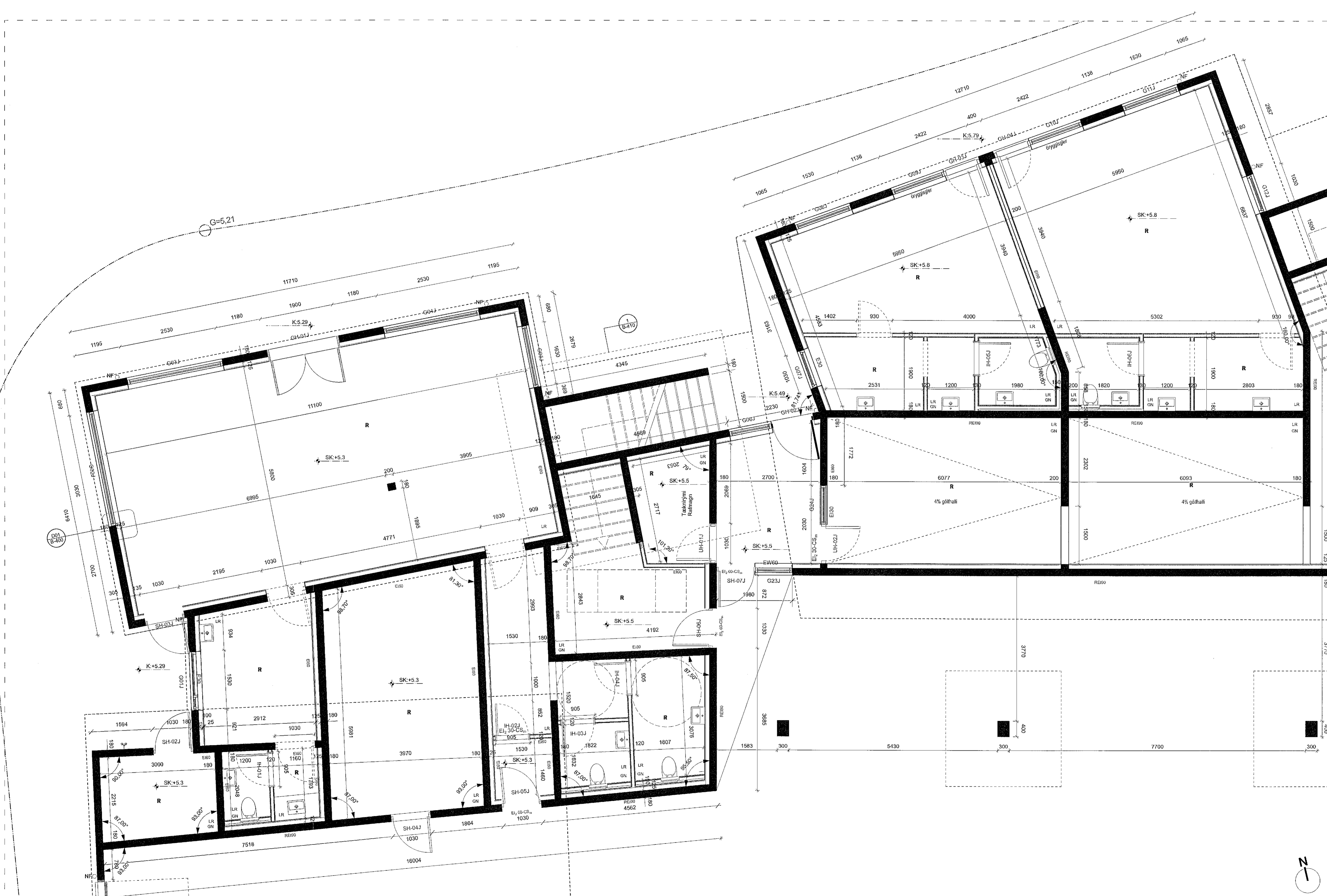
4 GRUNNMÝND JARÐHÆÐAR (1/4) Skali: 1:50

TEKNIÐ ER EKKI ENDRITTAT VEIÐNEMMETTA Á SAMPLÖGUM LEYFIS HOFRUNUM