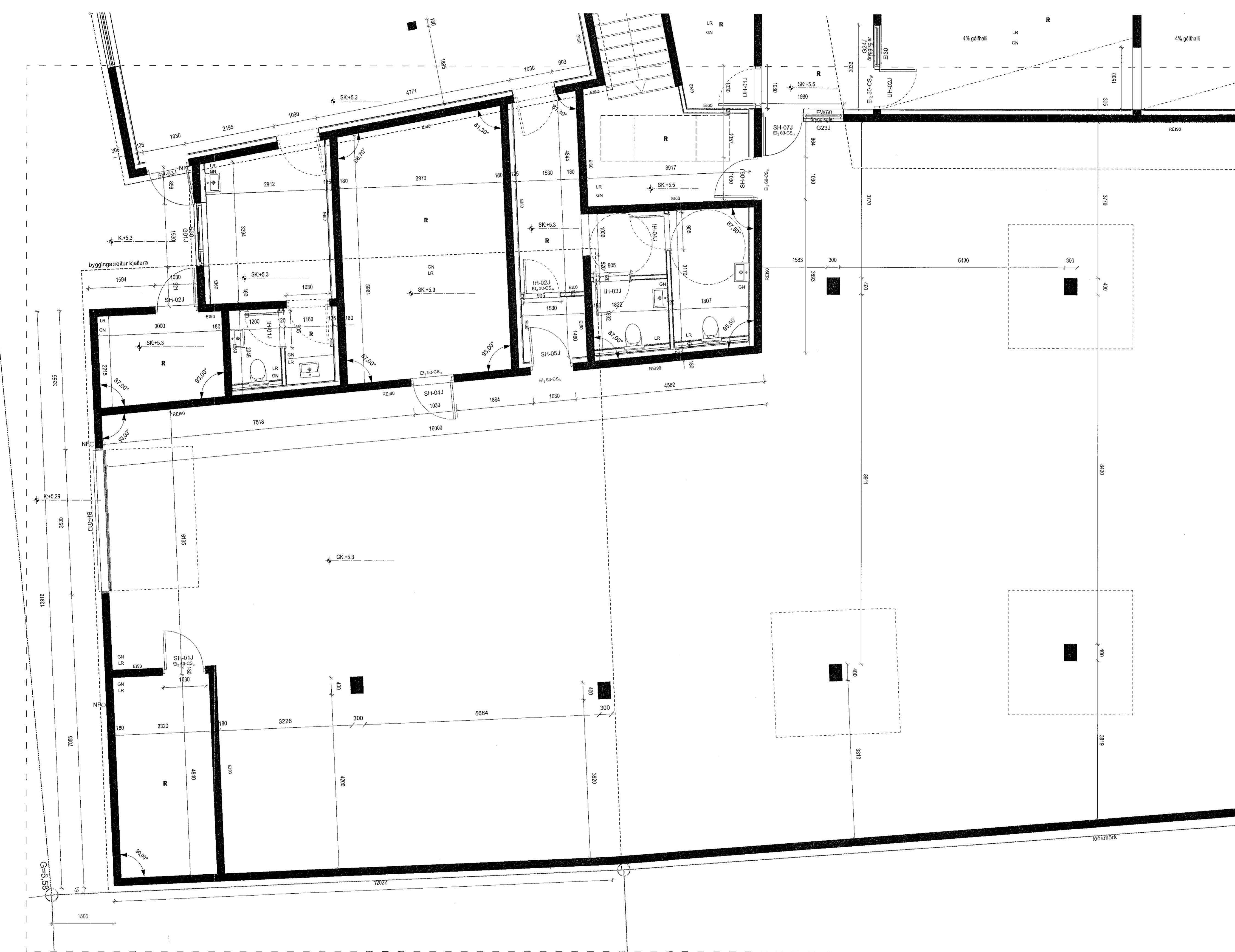
7 GRUNNMYND JARÐHÆÐAR (4/4) Skali: 1:50

TEIKNINGUÞESS MÁ EKKI ENDURNOTA Eða AÐRANNA LÖGVAÐAÐA Eða SKEMMILEGS LÖGVAÐAÐA