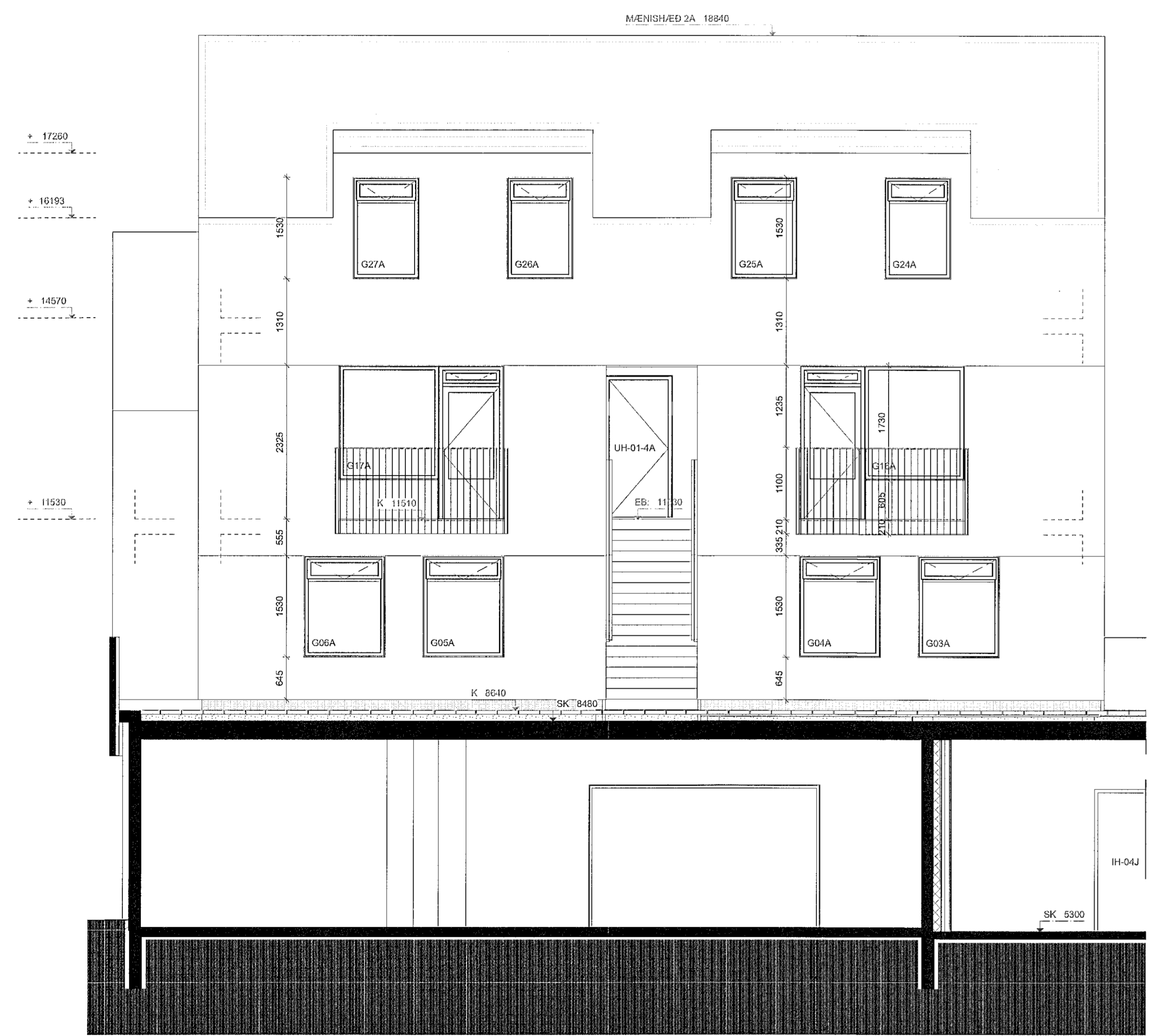
3 ÚTLIT 2A AUSTUR Skali: 1:50