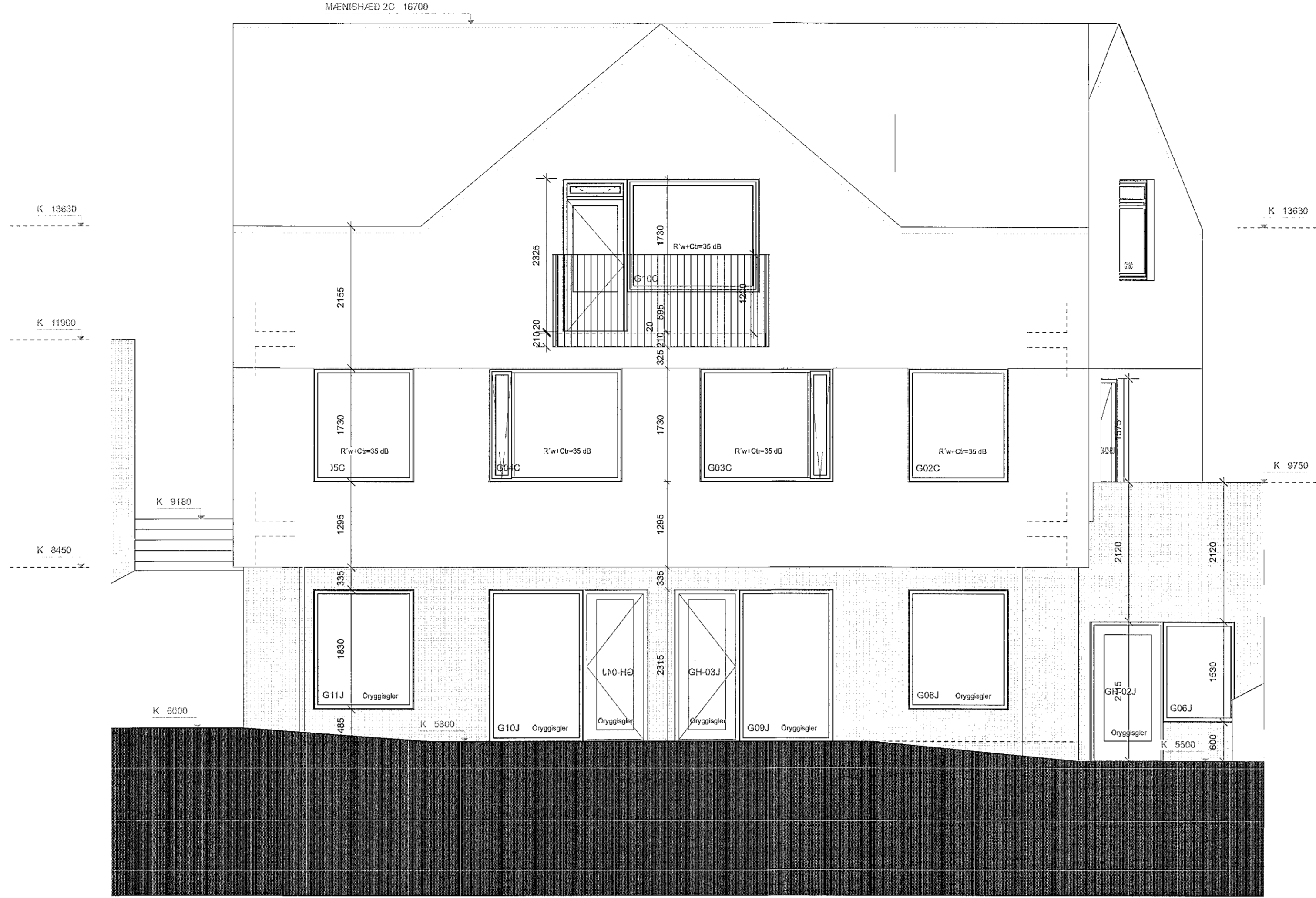
3 2C ÚTLIT NORDUR Skali: 1:50