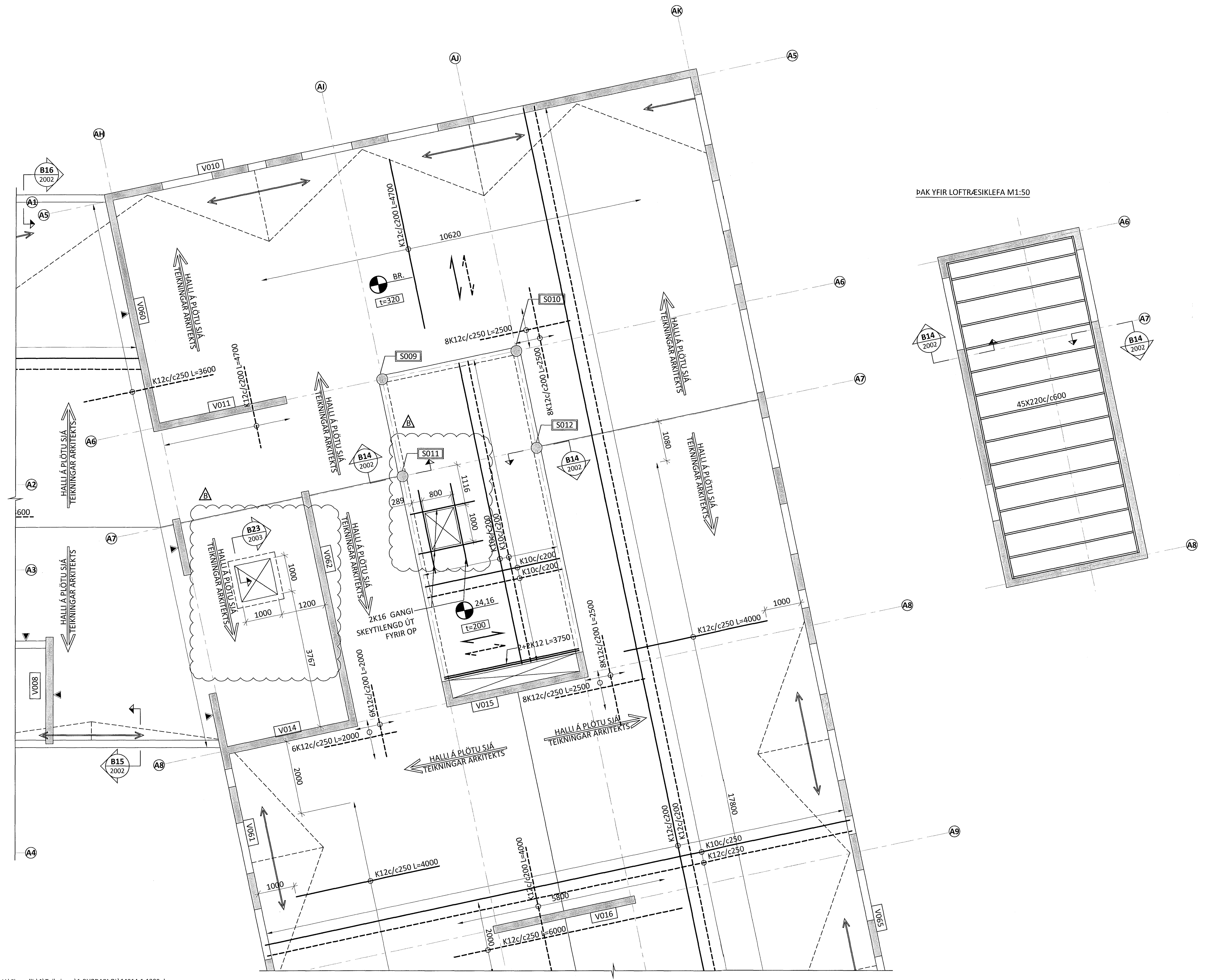
ÞAK YFIR LOFTRÆSIKLEFA M1:50