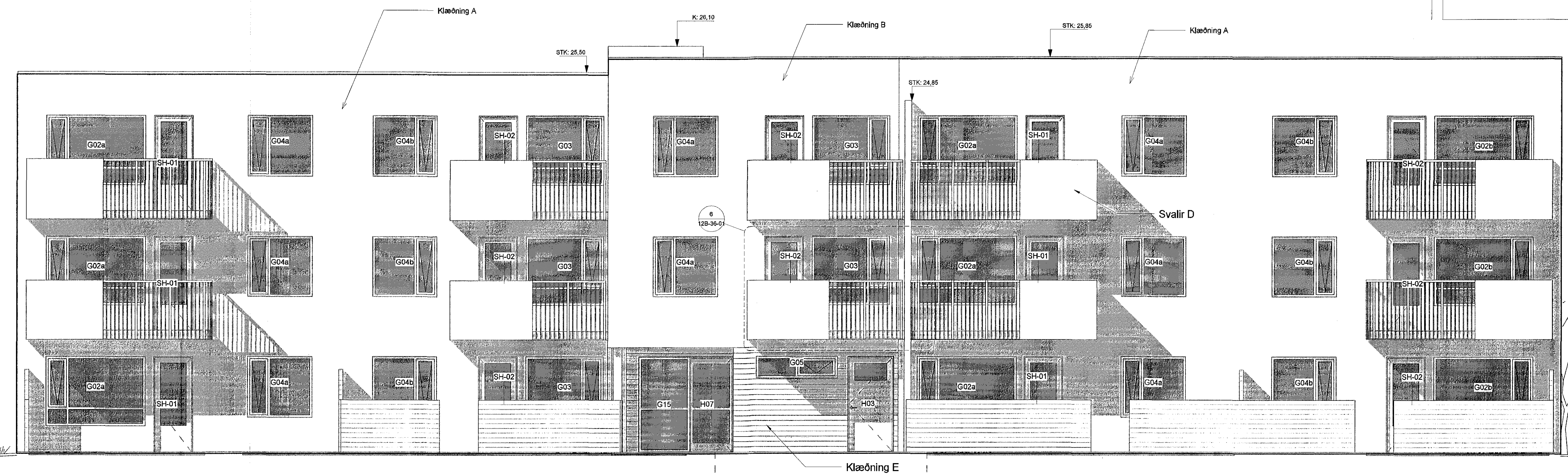
1 Vesturhlíð 1:50

Stærðir og mælingar á milli gættu og á milli gættu og