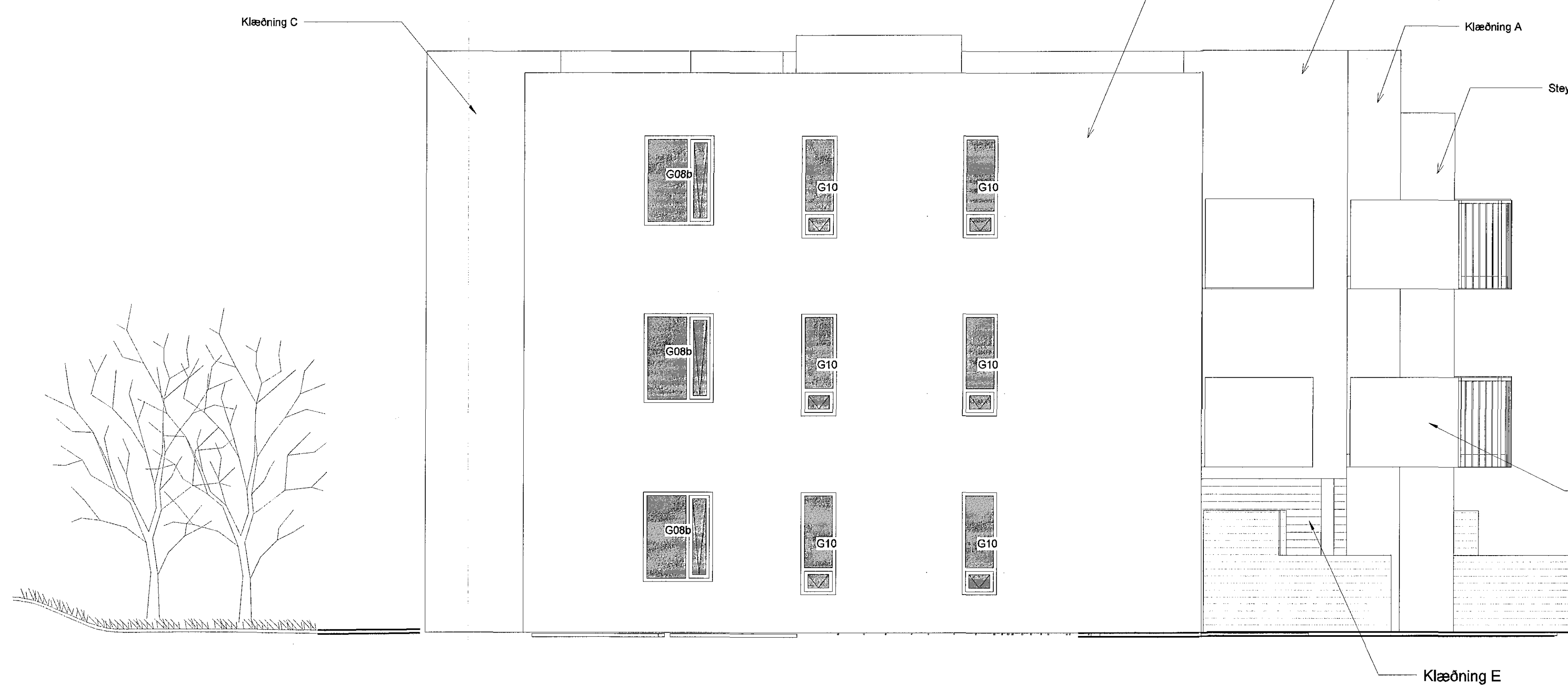
2 Norðurhlíð 1:50