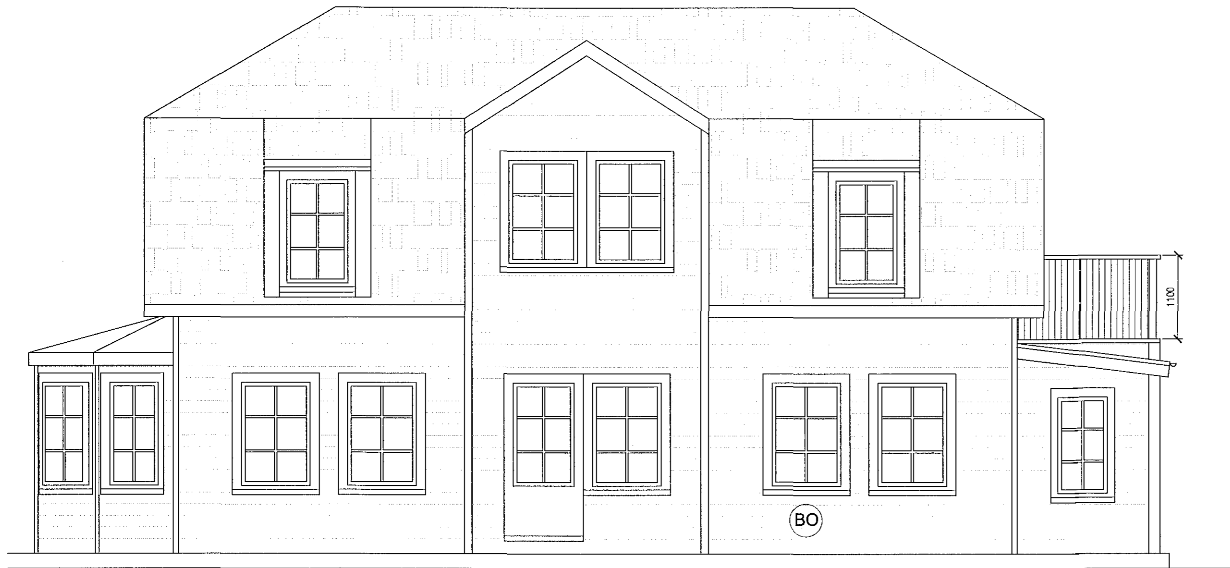
ÁSÝND SUÐ-VESTUR mkv. 1:50

Samþykkt þann 24. júní 2016 Byggingafulltrúinn P. Kalmfirdi