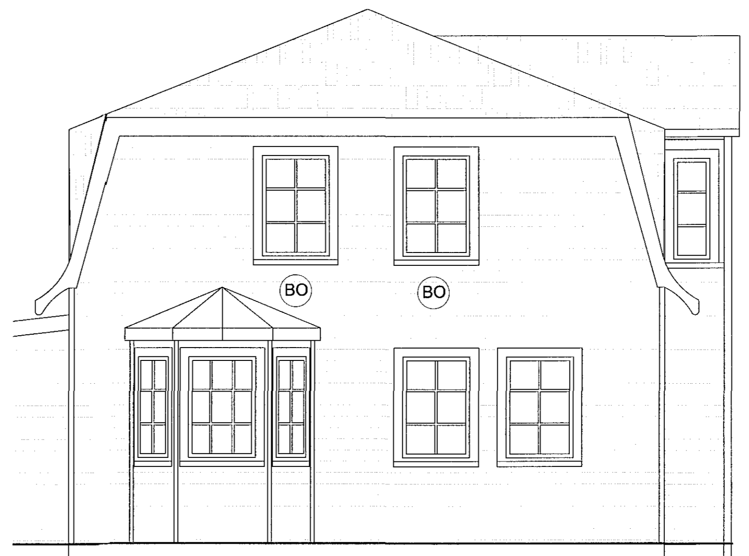
ÁSÝND NORD-VESTUR mkv. 1:50