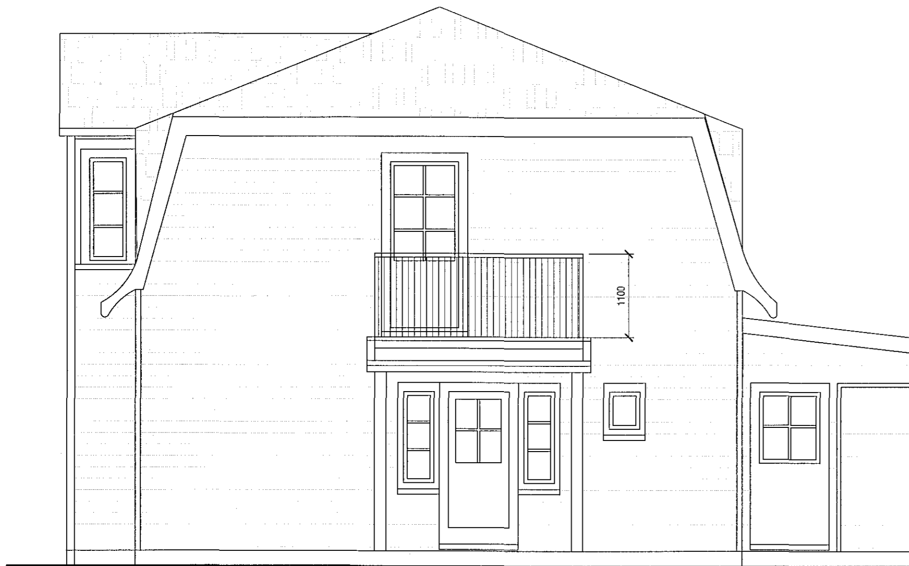
ÁSÝND SUÐ-AUSTUR mkv. 1:50