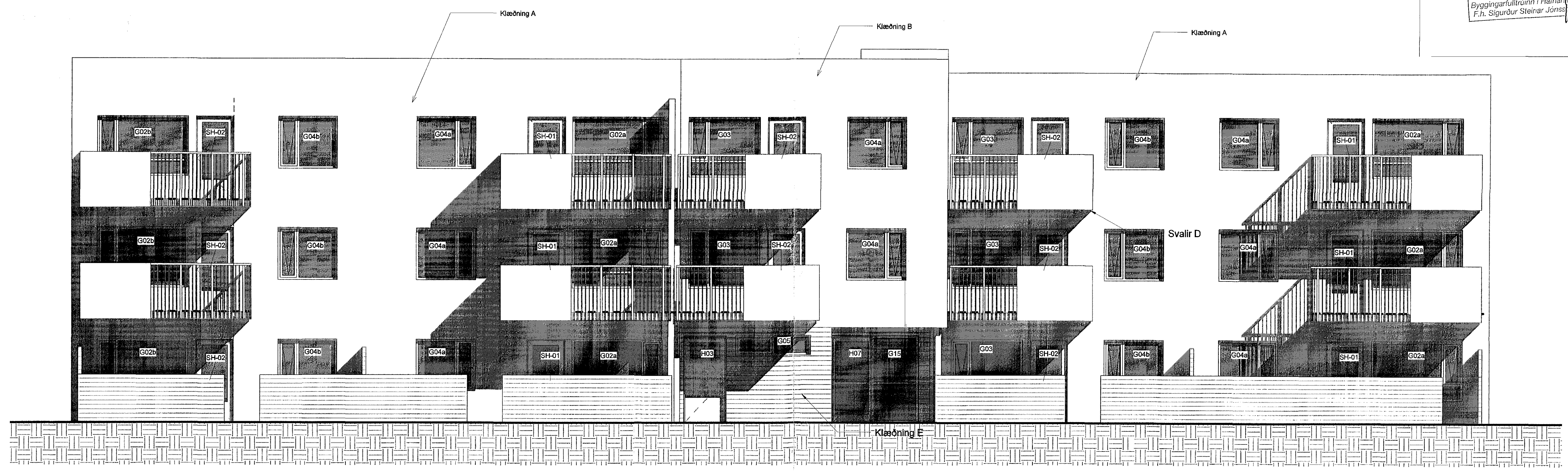
1 Ásýnd 12A Vestur 1 : 50

Samþykkt þann 27 SEP 2016 Byggingarfulltrúinn í Hafnarfirði F.h. Sigurður Steinar Jónsson