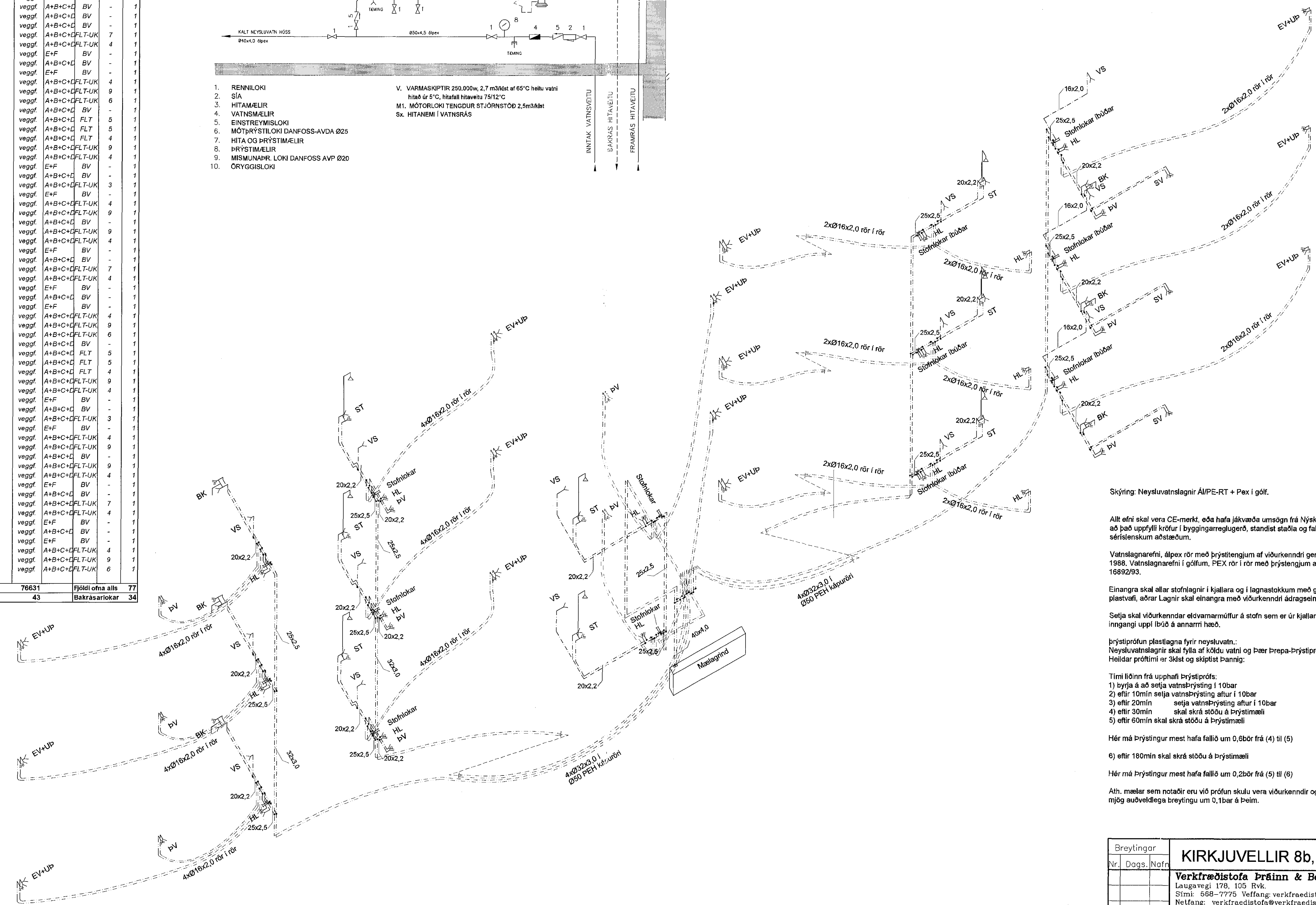
RÚMMYND NEYSLUVATN 1:50

Skýring: Neysluvatnslagnir A/PE-RT + Pex í gólf.