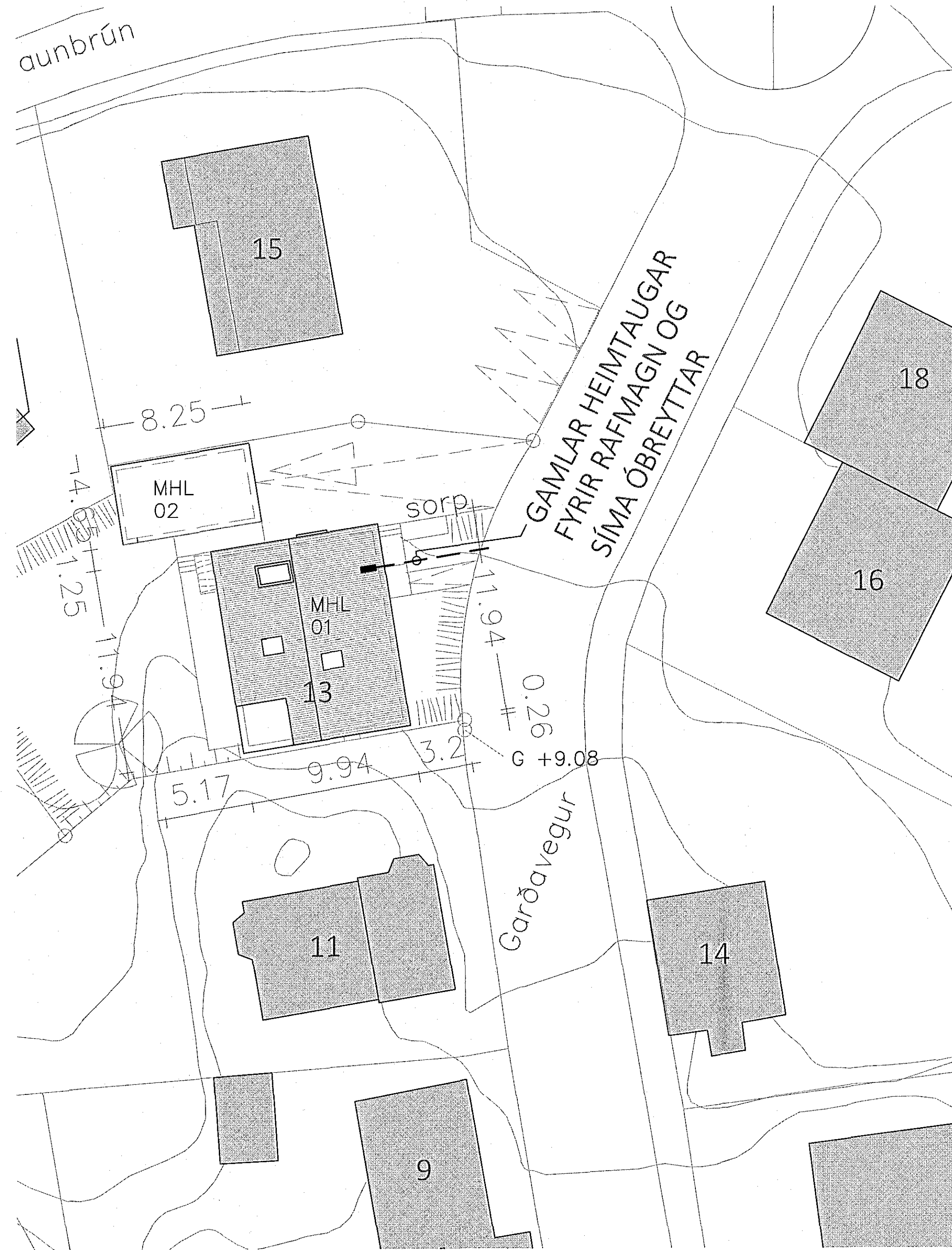
AFSTÖÐUMYND FYRIR GARÐAVEG 13, HF

Aðalhönnuður Olga Guðrún Sigfúsdóttir arkitekt Kennitala: 112069 4399