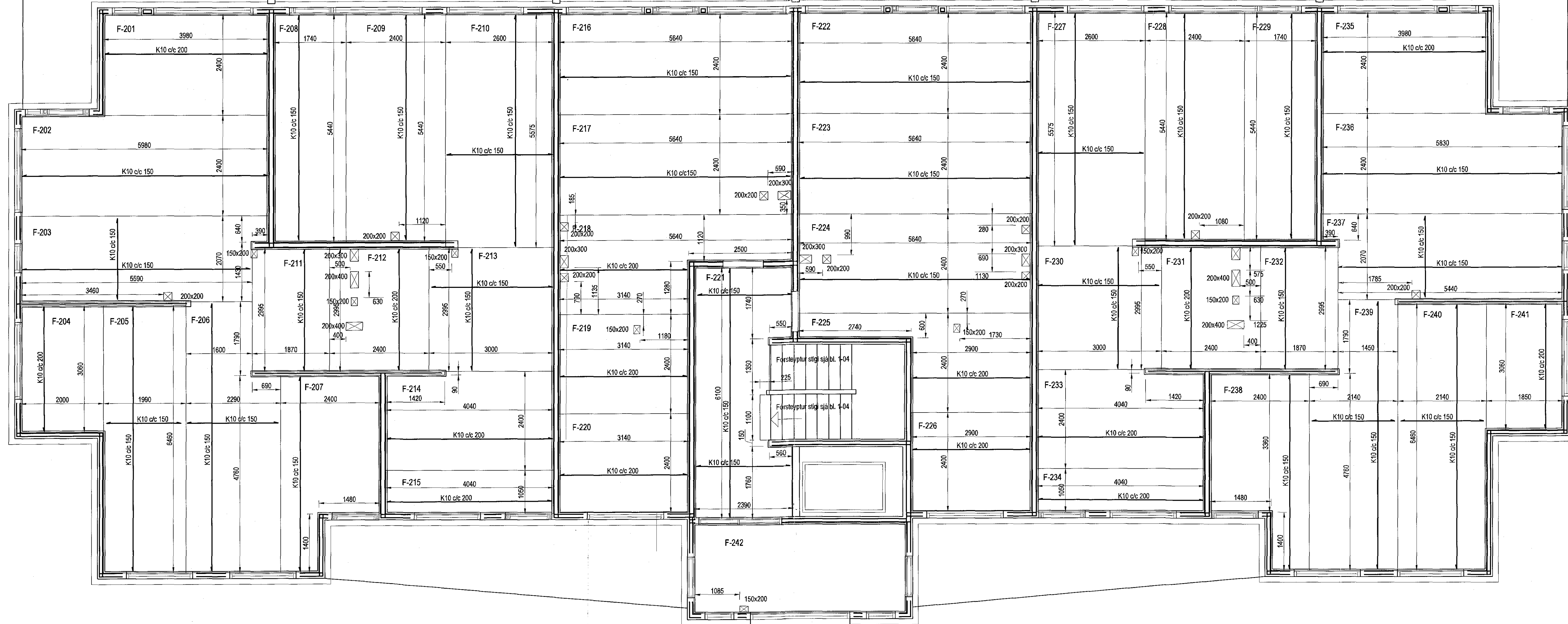
Filigranplötur yfir 2. hæð, Grunnmynd, 1:50

Sampykkt þann 15 MAJ 2017 Byggingarfulltrúi: Hafnarfirði F.h. Sigurður Steinn Jónsson