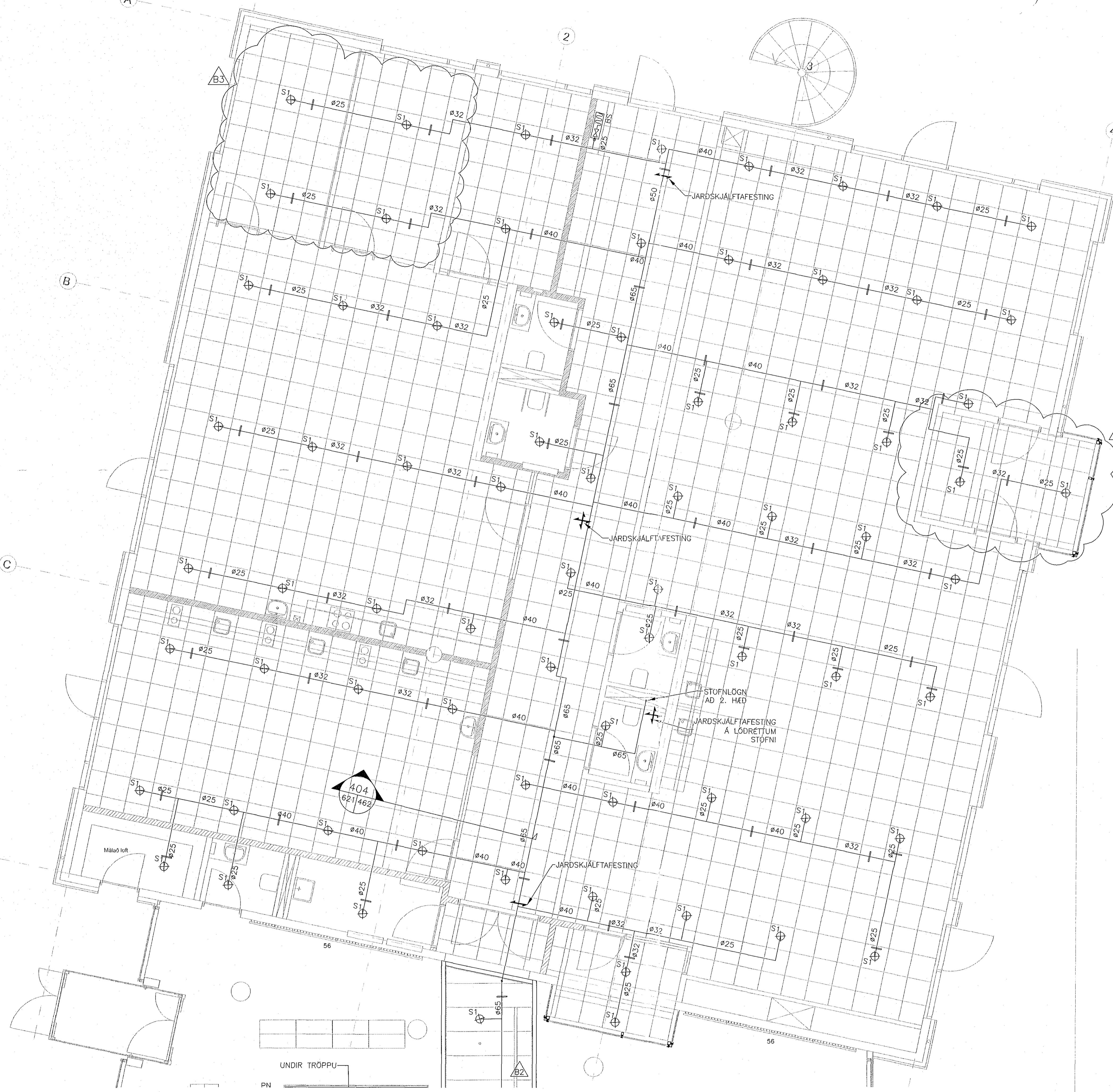
GRUNNMÝND MKV. 1

TÖLUVORÐA: S:\3\m151-hafnarfjardur\031-Hraunvallasól milli bryggjar 2015\7 TEIKNINGAR\RP-ÞPULAG\RP1-621-623.dwg