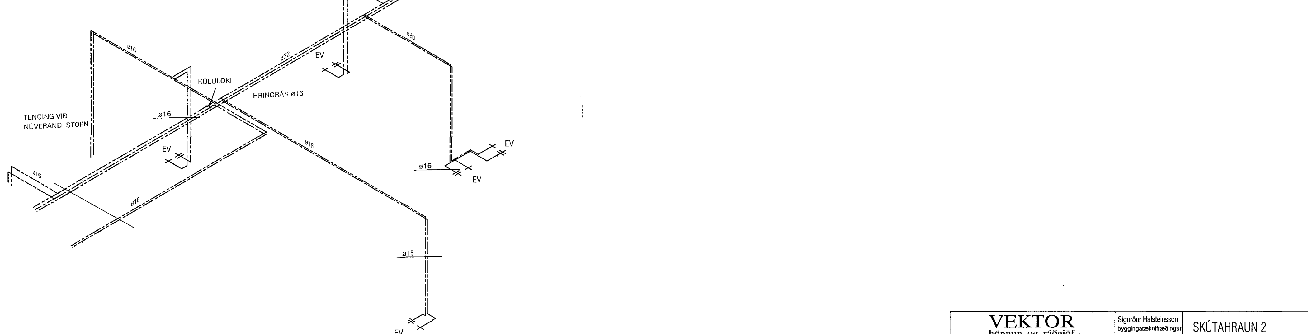
RÚMMYND 3. HÆÐAR TIL HÆGRI NEYSLUVATN MKV. 1:50