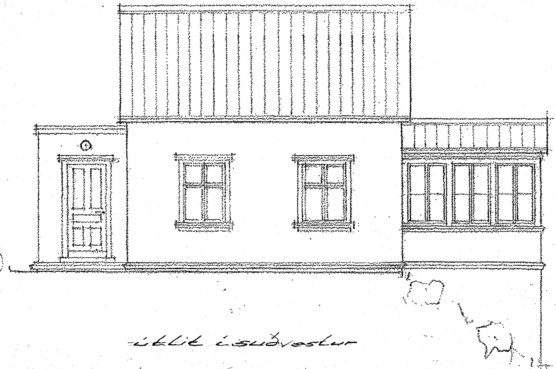
útlit í suðvestur

Samþykkt þann 13 NOV 2018 Byggingarfulltrúinn í Hafnarfirði F.h. Sigurður Steinar Jónsson