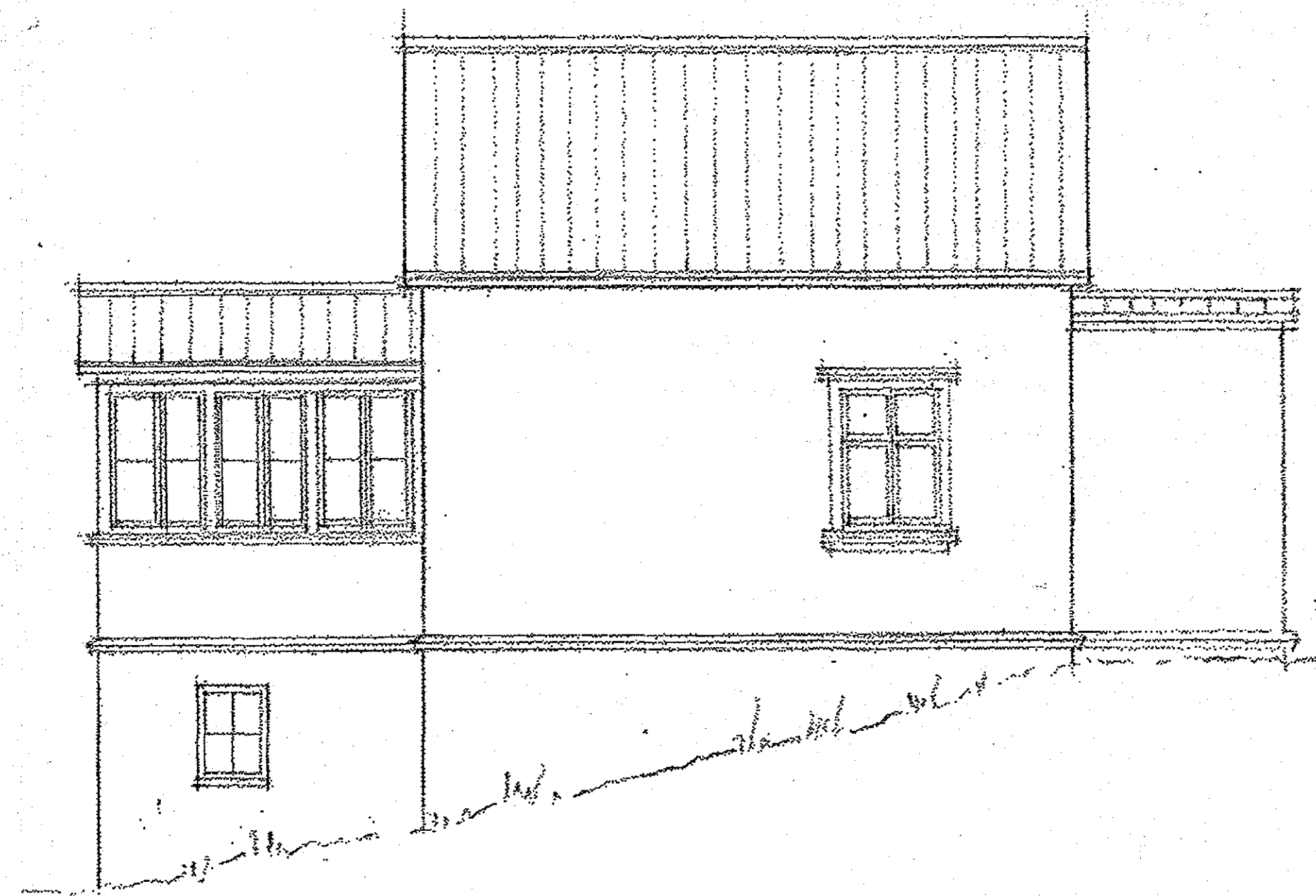
útlit í norðaustur