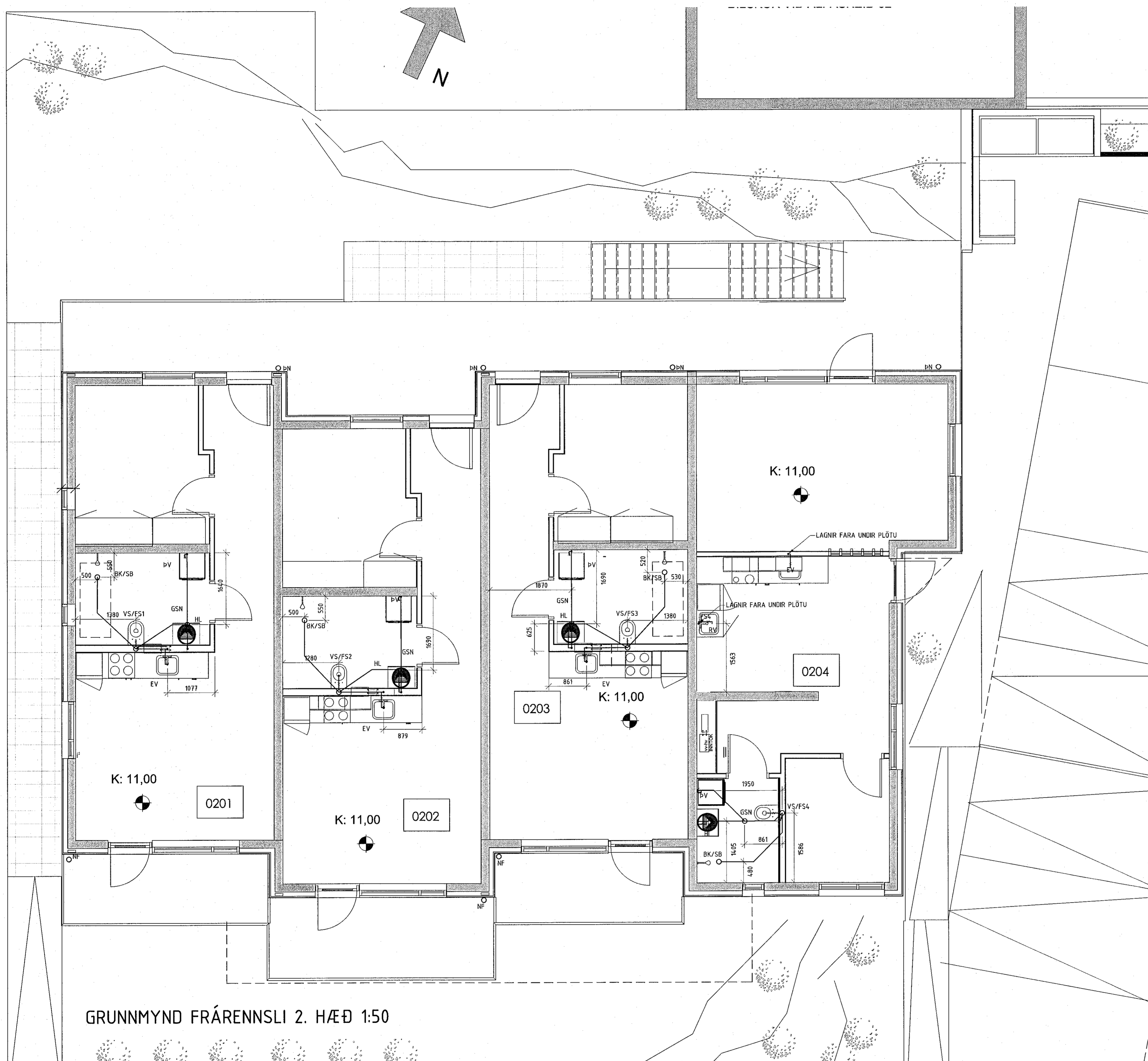
GRUNNMYND FRÁRENNSLI 2. HÆÐ 1:50

Áritun byggingarfulltrú: (Þetta hefur verið tekið tillit til í öllum byggingarfulltrú)