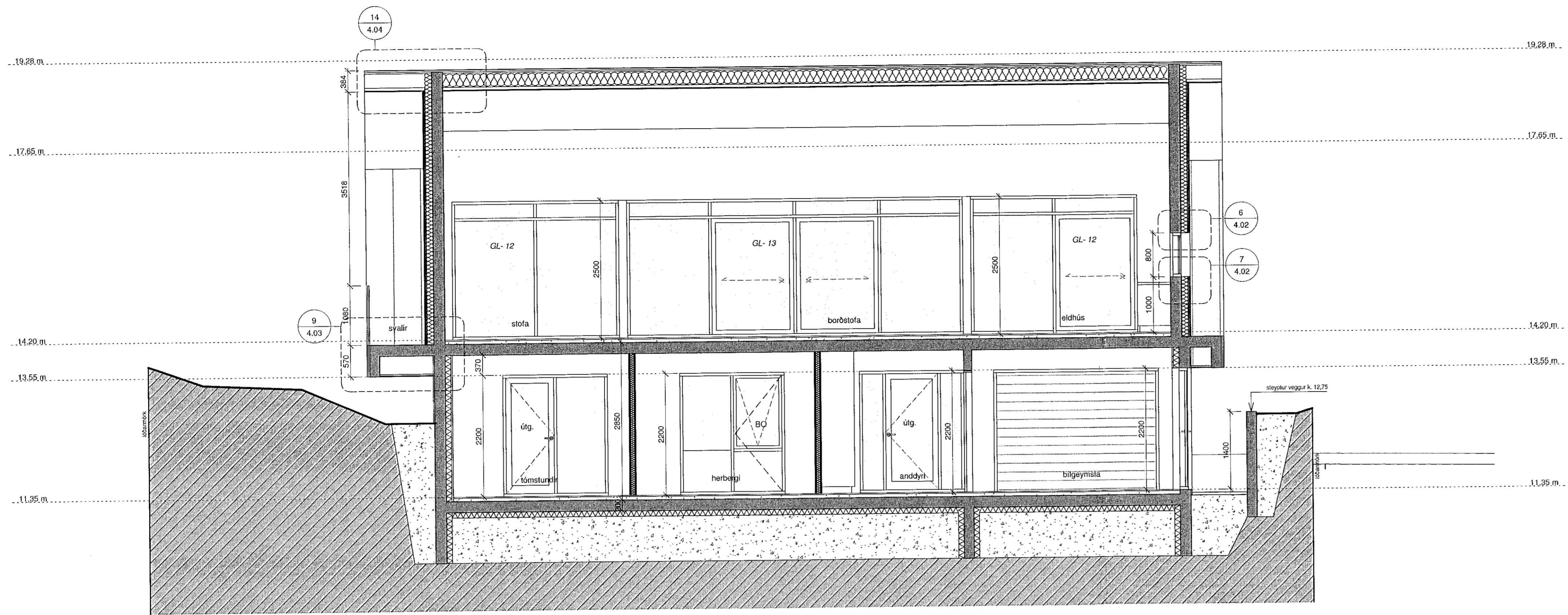
SNEIDING C-C 1:50

Öll mál takist/staðfærís á staðnum áður en smíði hefst. Misræmi í teikningum skal talarlaust tilkynna hönnuðum. Teikningar arkitekta skal lesa með teikningum meðhönnuða.