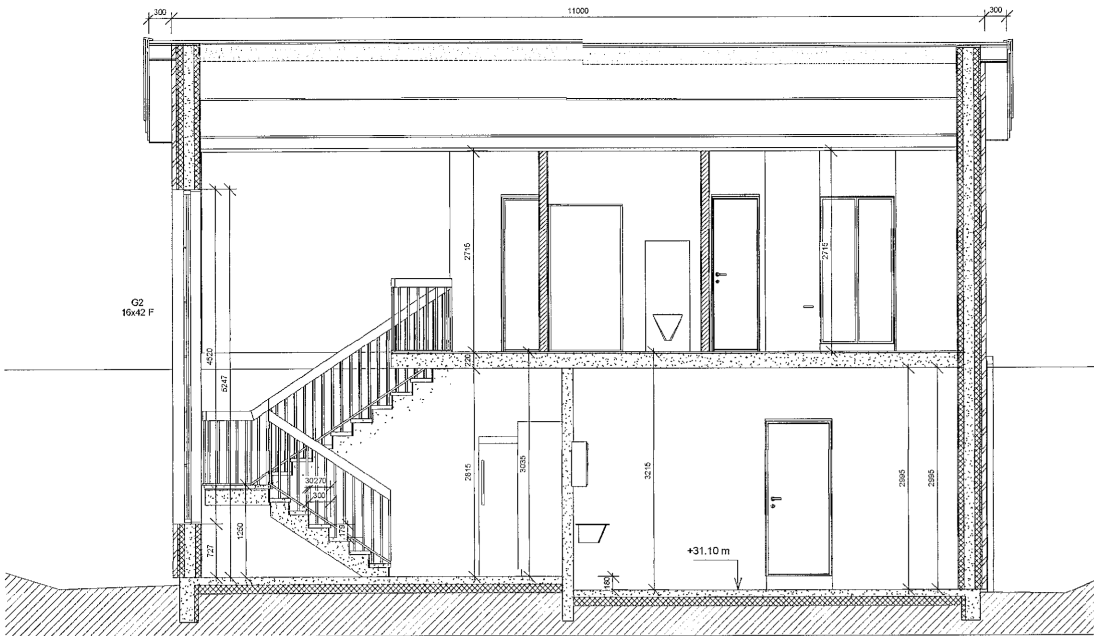
Verkteikn. Sneiðing A 1 : 50