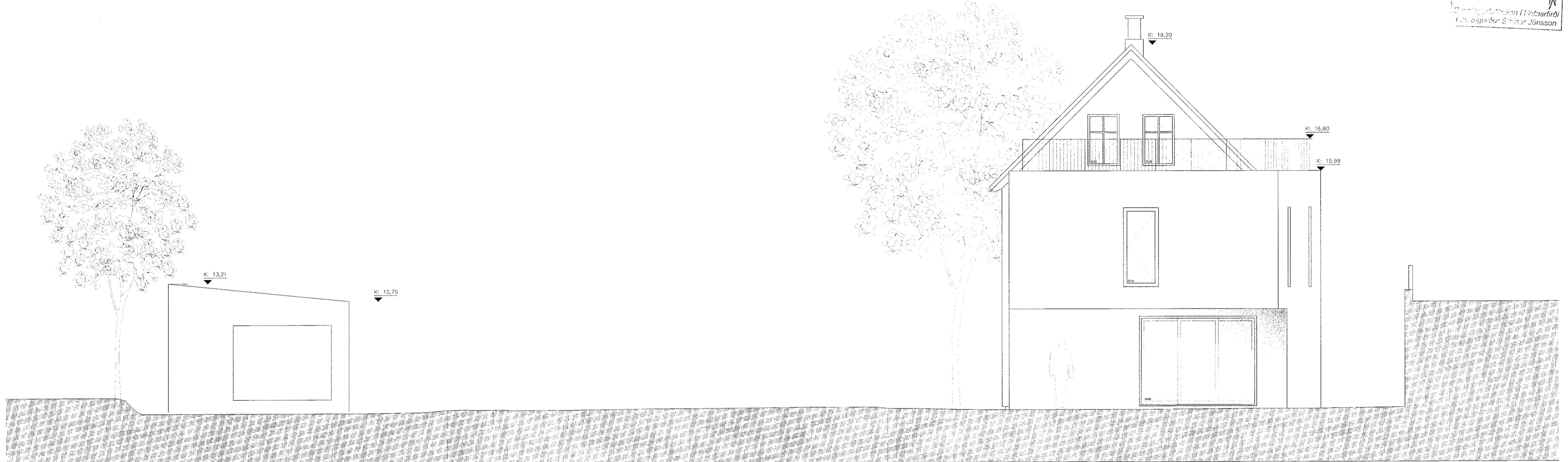
ÚTLIT SUÐUR MKV 1:50