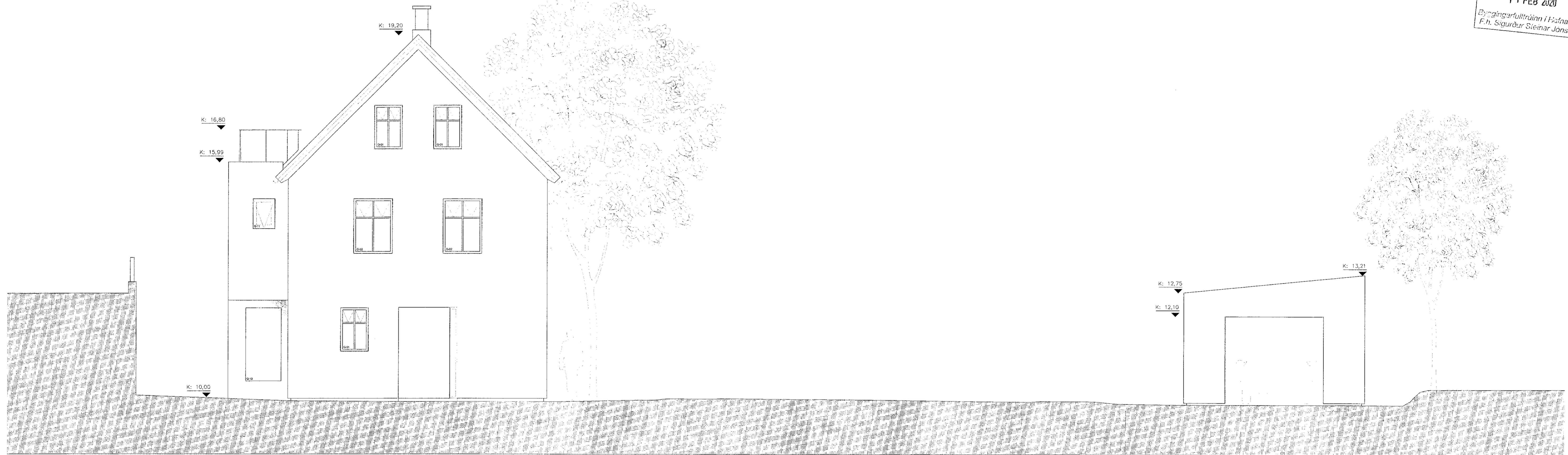
ÚTLIT NORÐUR MKV 1:50

Sambýkkt þann 14 FEB 2020 Byggingarfulltrúinn í Húsnámi F.h. Sigurður Steinar Jónsson