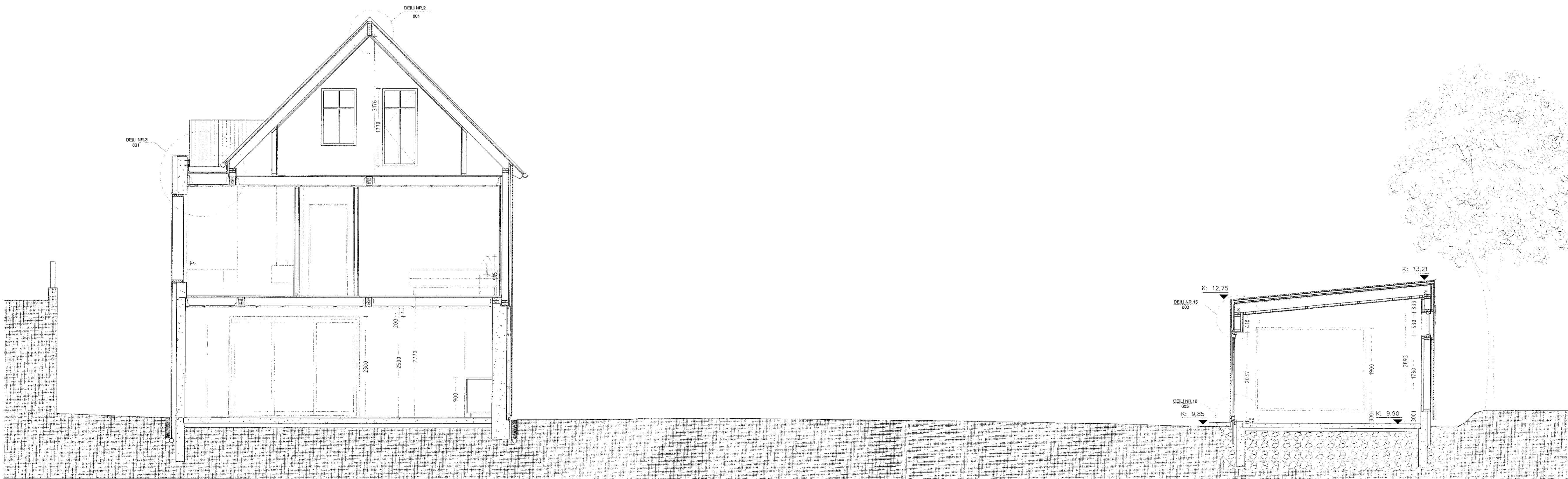
SNID B-B MKV 1:50