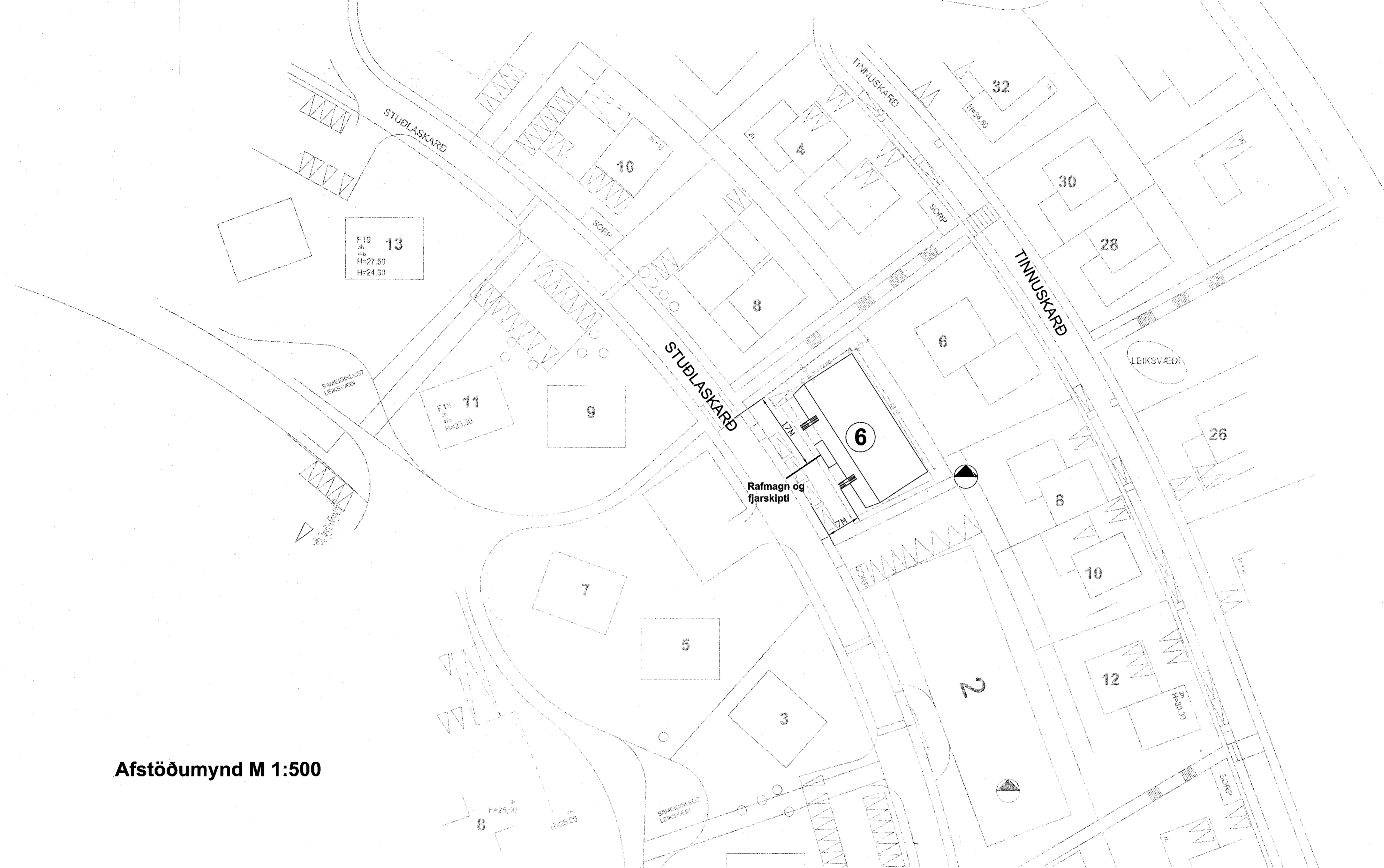
Afstöðumynd M 1:500

Skýringar: Lagnir séu 3x1,5q huldur 16mm plastpípulögn. Smáspennulagnir séu 20mm plastpípulögn. Málstraumur rofa og tengla sé 16A. Hæð á rofum sé 110cm, tenglar og smáspenna 20cm. Hæð á útvæggljósum sé 170cm. Hæð á veggjósum á bótum sé 200cm. Staðsetningar á létum veggjum mælast af arkitektaleikningum. Nákvæmar staðsetningar í eldhúsi og bótum ákveðist í samráði við eiganda og arkitekt. Öll mál mýðast við fullfrágengin gólf og á miðja dós. Nema annars sé getið.