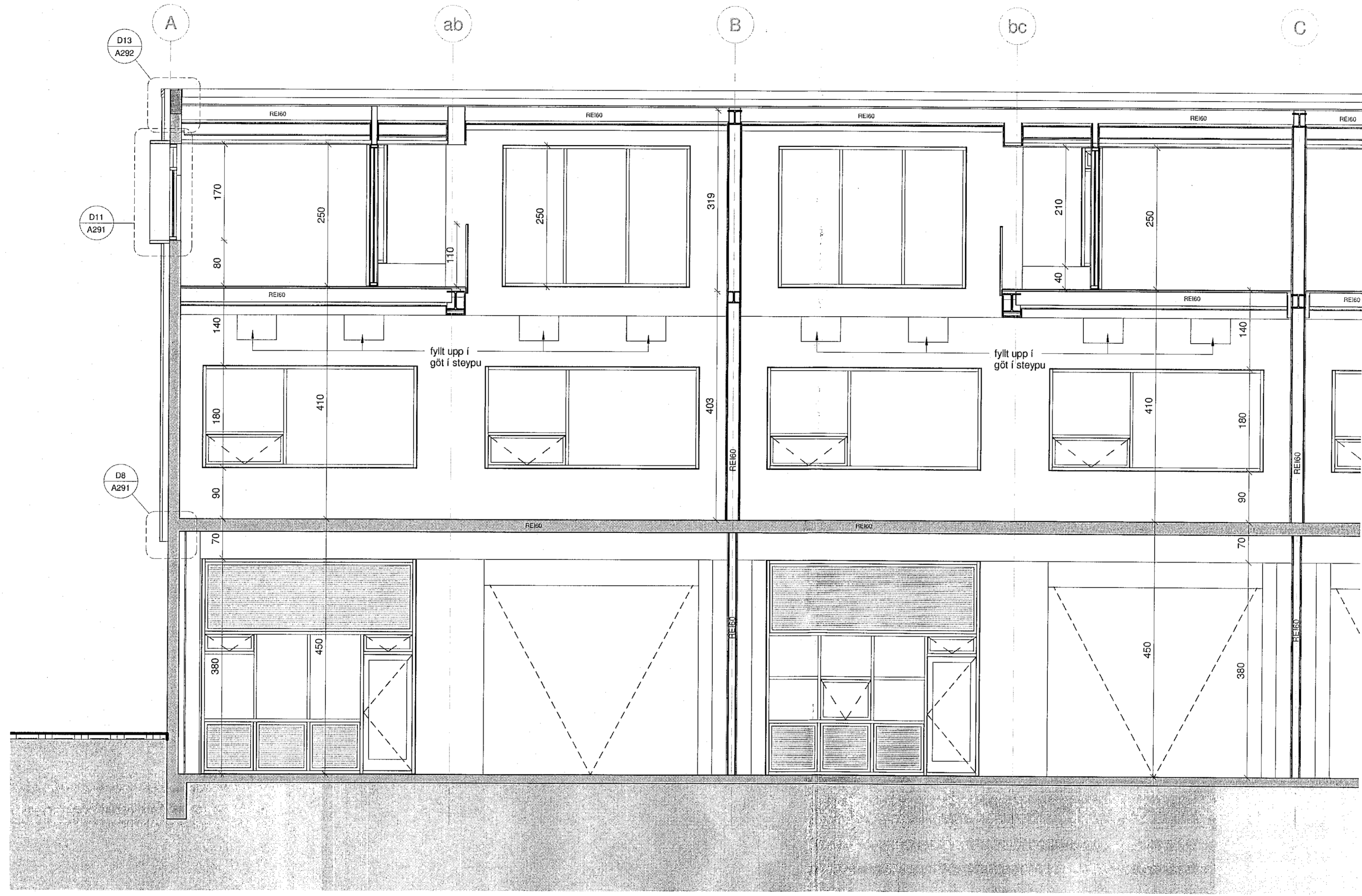
SNEIÐING B-B 1 : 50