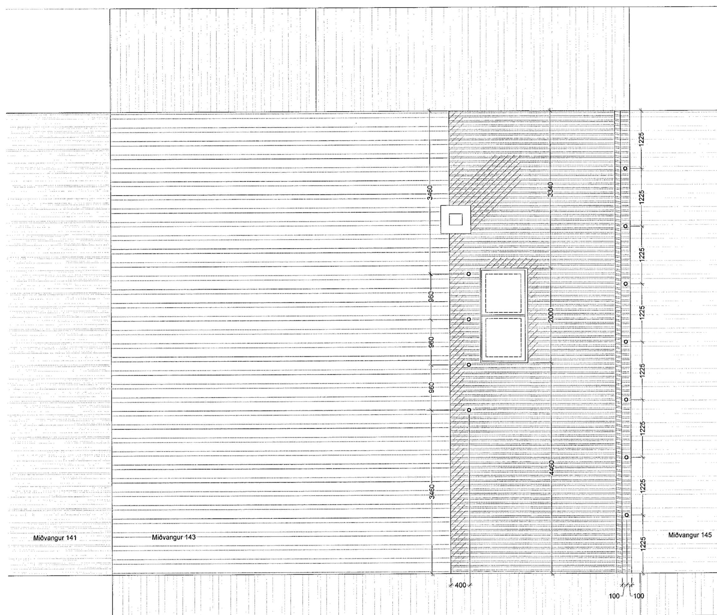
1 Þakmynd Mkv. 1:50

Upphaflegur hönnuður húss: Kjaran Sveinsson